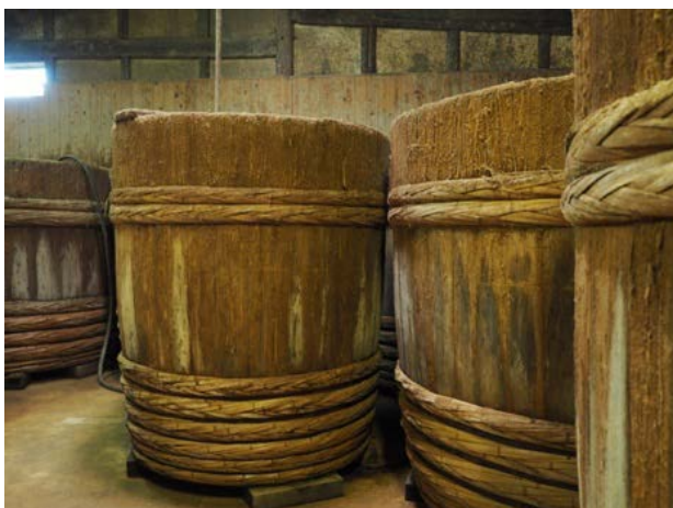
木桶を用いた醤油の製造（2019年11月16日、和歌山県御坊市堀河屋野村）