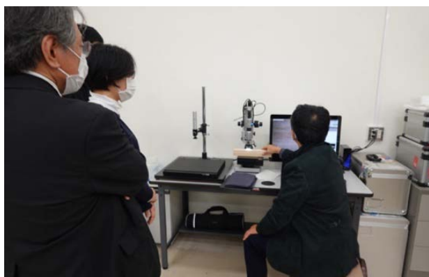
樹種同定の手法開発にむけての検討（2021年11月19日、民博共同利用型科学分析室）

森林科学の分野では、日本列島各地の多様な樹種や植生に関する詳細な情報がすでに蓄積されている。また、『木材ノ工藝的利用』（農商務省山林局、1912年）などの文献資料をもとに、木材製品の用途や加工法と樹種の対応関係に関する情報を収集することができる。本研究では、民博の標本資料から得られたデータを、このような既知の情報と対応させることにより、森林生態と森林資源の活用のあり方について検討する。さらに、素材の生産に携わる林業者が森林育成と木材