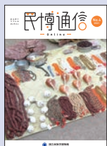
「民博通信 online」 No.4 2021年9月30日発行