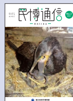
「民博通信 online」 No.3 2021年3月31日発行