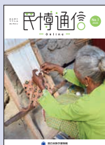
「民博通信 online」 No.1 2020年3月31日発行