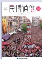
「民博通信 online」 No.2 2020年9月30日発行