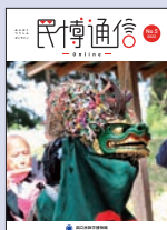
「民博通信 online」 No.5 2022年3月31日発行