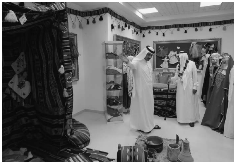
写真4 ワーディ・ファーティマ社会開発センターに収集・保管されている物質文化コレクションを見学