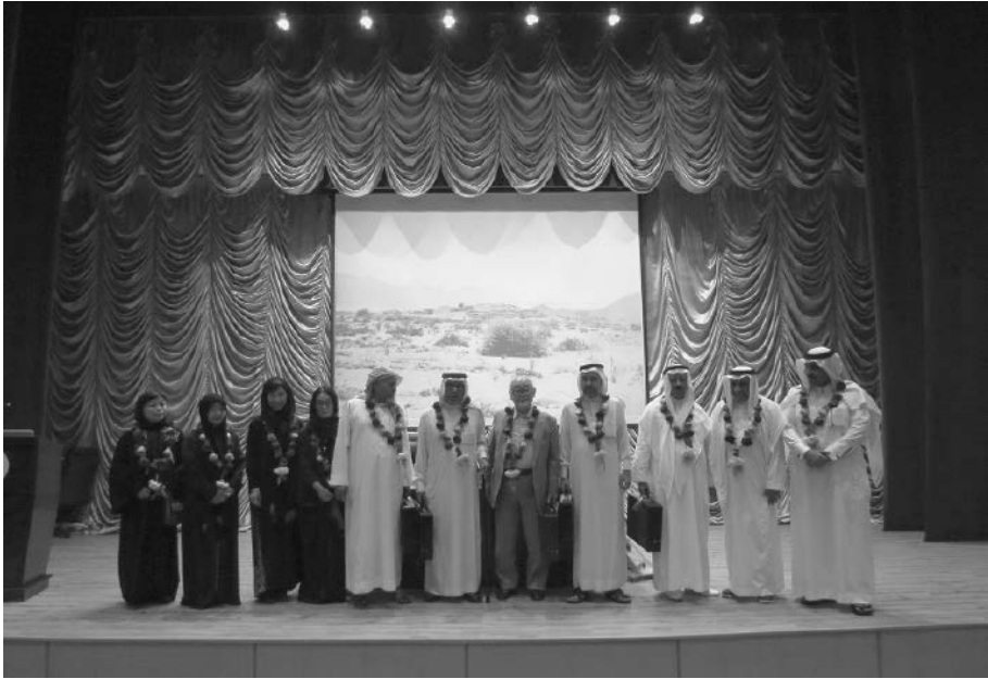
写真2 ワーディ・ファーティマ社会開発センター関係者との記念写真 撮影：縄田浩志，2015年3月25日，アル＝ジュムーム市