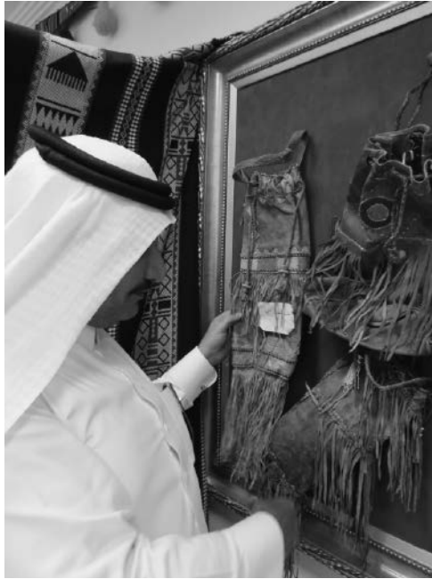
写真5 ワーディ・ファーティマ社会開発センターに収集・保管されている 物質文化コレクションについて職員から説明をうける 2015年3月25日，アル＝ジュムーム市