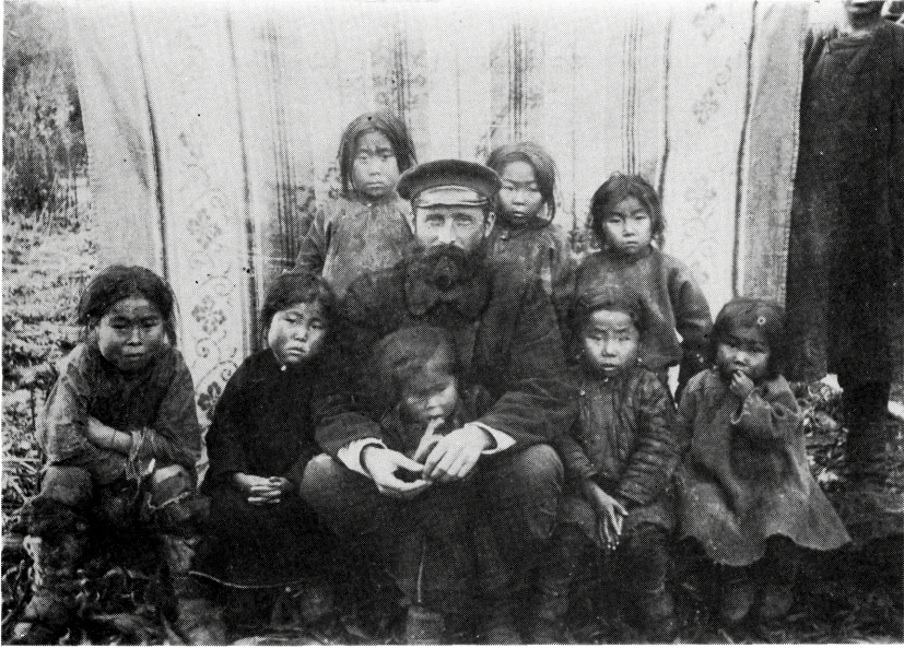
写真2 原住民の子供たちに囲まれて 撮影時期はサハリン時代（1887-1899）の前半と推定される。