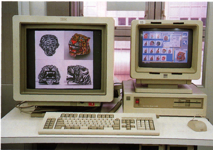
民族学研究用画像検索システム 右の検索用端末（パーソナルコンピューター）からホストコンピューターに検索を指示し、その結果が表示されている。左の高解像度ディスプレイの大画面に精密画像を同時に表示することができる。