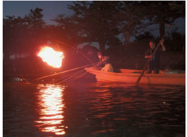
日本の鵜飼は夜間に篝火のもとでおこなわれることが多い。写真は京都府宇治市の宇治川の鵜飼のようす（2014年）。

国立民族学博物館人類文明誌研究部准教授。専門は環境民俗学、日本・東アジア地域研究。著書に『鵜飼いと現代中国一人と動物、国家のエスノグラフィー』（東京大学出版会 2014年）、論文に「旧ユーゴスラヴィア時代における鵜飼漁の技術とその存立条件」『国立民族学博物館研究報告』45(1): 1-80（2020年）などがある。