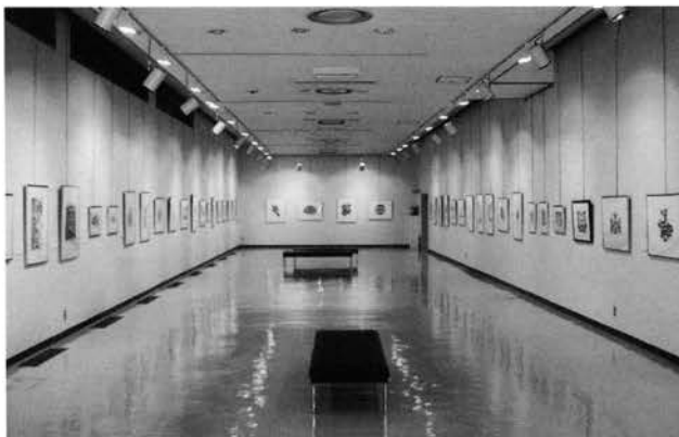
市立美術館の展示の様子