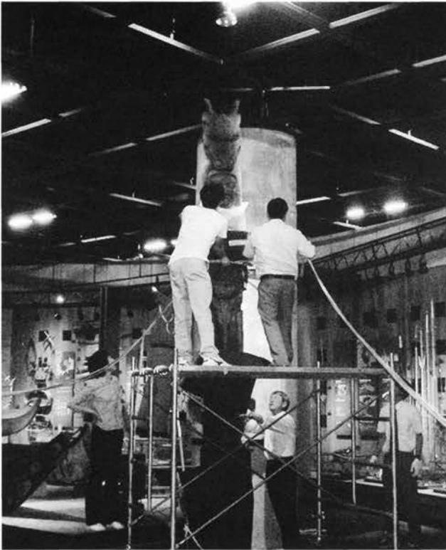
職員によるトーテムポールの移動作業

良い点ばかりを述べているようだが、反省点も多々ある。観覧者数も、近年の特別展と比べてやや減少している。その理由については、展示内容の評価等と合わせて、これから分析せねばならない。