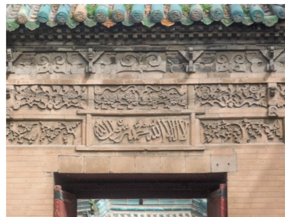
西安の大清真寺(モスク)の入り口。アラビア語で信仰告白の文が書かれている(2009年3月)。

「イスラームとは平和の意味」という説明にしても、イスラームをめぐるあいまいな状況が幾層にも重なり