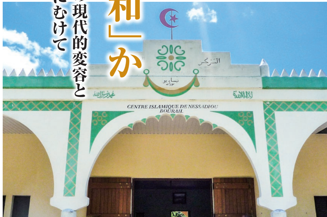
サウジアラビアの援助で建設されたニューカレドニアのモスクの入り口。アラビア語で信仰告白の文が書かれている(2010年2月)。