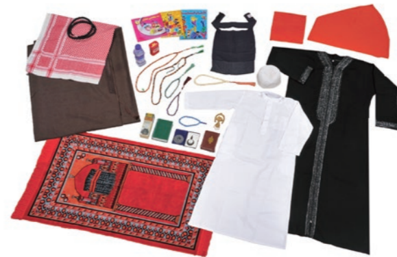
みんぱく「イスラム教とアラブ世界のくらし」

他者の立場をおもんばかり、その人がころから尊んでいるものを粗雑にあつかわないというのは、人としての当然のたしなみだろう。少女がころから尊んでいるイスラーム(イスラム教)の聖典コーランを、少