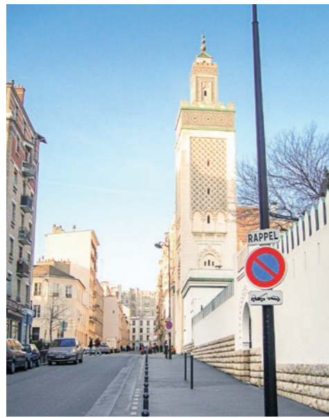
パリのモスク。歴史的建造物に登録され、マグリブ風のミニレットが街並みにとけこむ(2008年2月)。

して時代や場所によって異なった方策がとられたり、相反する解釈が併存していたりすることも多い。イスラームはこのような柔軟性、流動性によってコミュニティを維持して