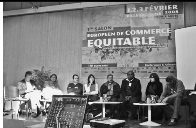
グローバルな支援活動であるフェアトレードの国際会議。

この点で経済史家ポラニーの洞察が参考になる。彼は著『大転換』の中で、19世紀以降の世界史を市場経済と社会