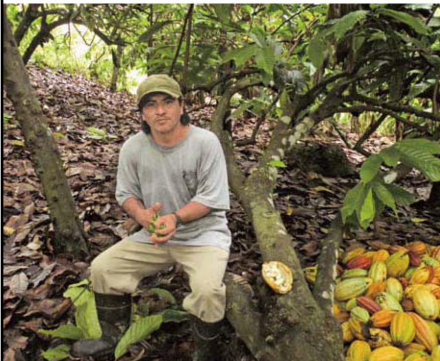
フェアトレードの支援をうけてカカオを生産する中米ベリーズ国の農民。

機関研究 ● 支援の人類学：グローバルな互惠性の構築に向けて（2009-2012）