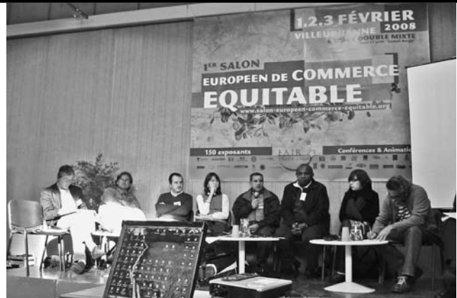
グローバルな支援活動であるフェアトレードの国際会議。

この点で経済史家ポラニーの洞察が参考になる。彼は著『大転換』の中で、19世紀以降の世界史を市場経済と社会