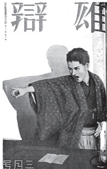
大日本雄弁会(現講談社)刊行の月刊誌『雄弁』の表紙(1931年6月号)。主に演説速記録を掲載し、当時の雄弁家を志す青年たちに読まれていた。

を共感という要素を軸に敷衍して、他者との直接的な結合にかかわる領域(応援)と、距離感をもちつつ接合する領域(支援)とを区分したことも、そうした点にかかわっているように。