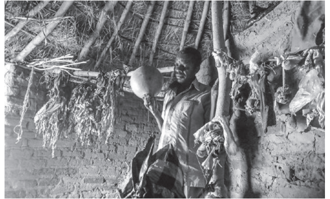
アフリカの呪術師(2015年、ウガンダ)。

グは応援か」という発表で、カナダのアイスホッケーのなかでも試合が殴り合いに転調するファイティングという行為に注目する。もともとはどこのチームでも、エンフォーサーとも呼ばれるファイティングの任務に特化したメンバーがいた。彼はチーム内でほかの花形選手を応援するという位置づけにあったが、時代の変化の中で、徐々に試合の進行により直接的にかかわる普通の選手となっていく傾向があることが分析された。ある意味興行的な側面がそがれ、スポーツとしての勝敗に徹するスタイルに洗練されつつあるといえようか。共同研究会の場では、ヨーロッパのアイスホッケーでは比較的ファイティングがみられないということから、北米的な暴力に関する規範との関係や、チーム内という限定されたなかでの役割だけではなくひろく客席の観客の応援との関係に踏み込んだ分析が必要ではとの意見が交わされた。