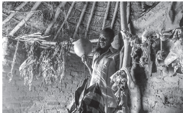
アフリカの呪術師（2015年、ウガンダ）。

グは応援か」という発表で、カナダのアイスホッケーのなかでも試合が殴り合いに転調するファイティングという行為に注目する。もともとはどのチームでも、エンフォーサーとも呼ばれるファイティングの任務に特化したメンバーがいた。彼はチーム内でほかの花形選手を応援するという位置づけにあったが、時代の変化の中で、徐々に試合の進行により直接的にかかわる普通の選手となっていく傾向があることが分析された。ある意味興行的な側面がそがれ、スポーツとしての勝敗に徹するスタイルに洗練されつつあるといえようか。共同研究会の場では、ヨーロッパのアイスホッケーでは比較的ファイティングがみられないということから、北米的な暴力に関する規範との関係や、チーム内という限定されたなかでの役割だけではなくひろく客席の観客の応援との関係に踏み込んだ分析が必要ではとの意見が交わされた。