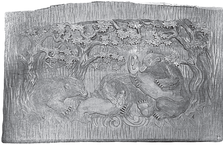
木彫品(H0149594)。3頭の熊に鮭、もみじなどが彫られている。