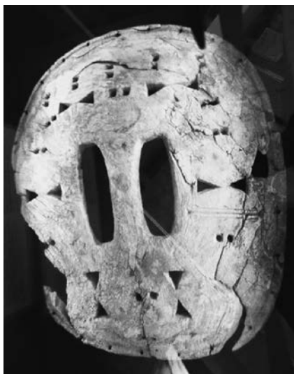
图3 有着沙漏形孔洞的鼓框架 (瑞典约克莫克萨米文化博物馆。)

在考古发现的碗形类型的萨米萨满鼓的木质框架上，有很多沙漏形状的镂空，这些孔洞代表着神灵借此进出的出入口（Zachrisson 1991: 81）。另外，在北部类型的萨米萨满鼓的鼓面，其天、人、地三界的分层的分隔线在中心位置不是贯穿的，而是有一个空隙，从纵向看，这三个空隙构成的线路象征萨满在三界间自由旅行的通道。这两点都佐证了萨米萨满鼓在萨满的昏迷状态中发挥的召集神灵的辅助作用。参见下面两图：