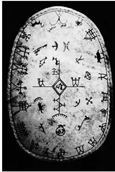
右面的鼓是框架式的类型