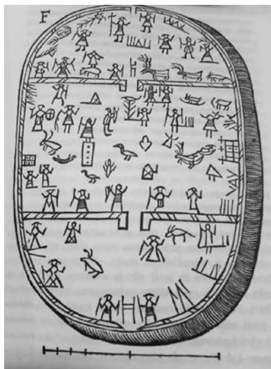
图4 有着三层的宇宙分布并且三层之间有空隙贯穿的鼓面图案