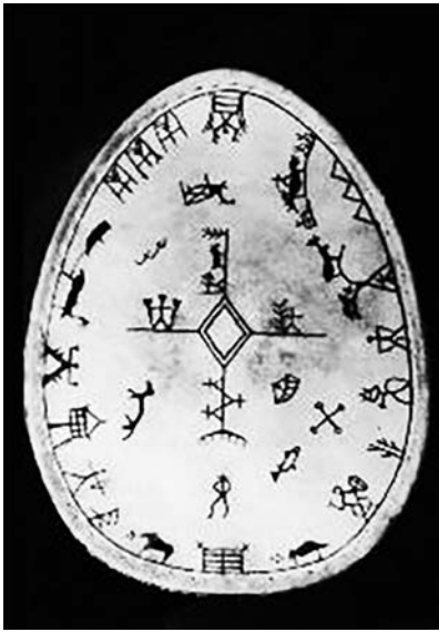
左面的鼓是碗形的类型

满鼓》第一卷，这种类型的鼓后来不论在萨米地区南部还是北部都已经被逐渐取代了。取而代之的是在它的基础上发展而来的一种称为碗形的类型，这种类型的鼓为萨米文化所特有。从这种鼓最初见于对它的详细表述之时，它就远比框架的类型分布广泛，后来取代它也是发生在很早的时候。通常的观点认为框架的类型由于形体大，重量大的缺点而被人们逐渐放弃使用（Zachrisson 1991: 81）。在形状上，框架的类型是基本标准的椭圆形，而碗形的类型是顶端比底端稍尖的蛋形，参见下面两个对照图：