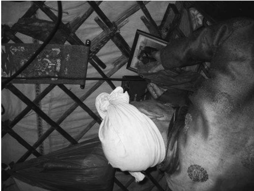
7. ノースタイは毎晩亡くなった妻の写真の前に線香を捧げて折る。