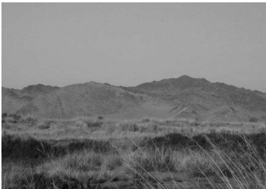
13. トウグ (ハネガヤ草の一種)、ダシワンジル山の周辺。