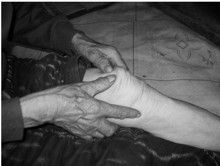
9. ノースタイの脚の傷 (DM300115参照)。