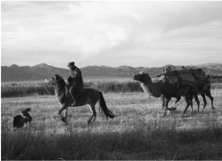
11. 駱駝に荷を載せて移動する風景。