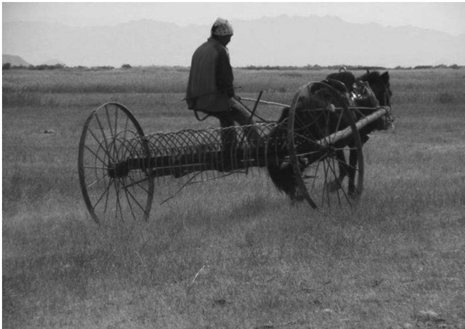
12. 「モリン・マシン (馬の機械)」とよばれる車 (DM300085(5) 参照)。