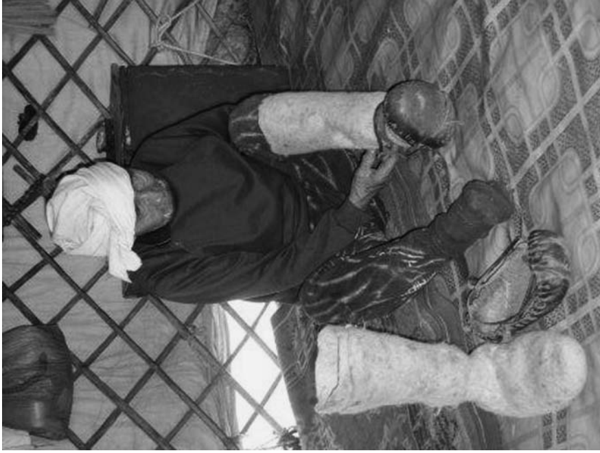
8. 西モンゴルに特有の、トーク靴の履きかた。