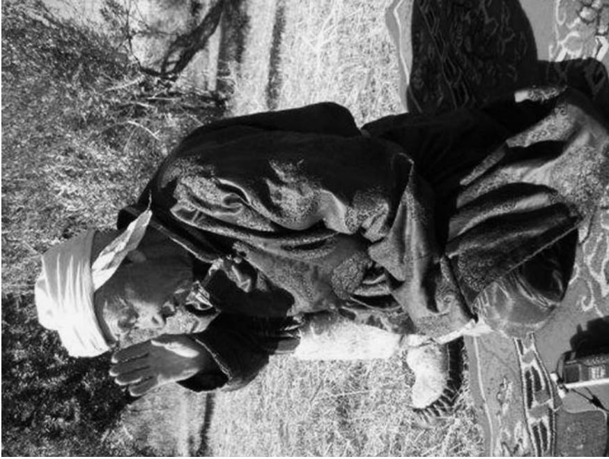
6. トルグードの伝統的衣装で身に纏ったノースタイ。靴と頭巾のかぶりかたはトルグードに特徴的であるとされている。