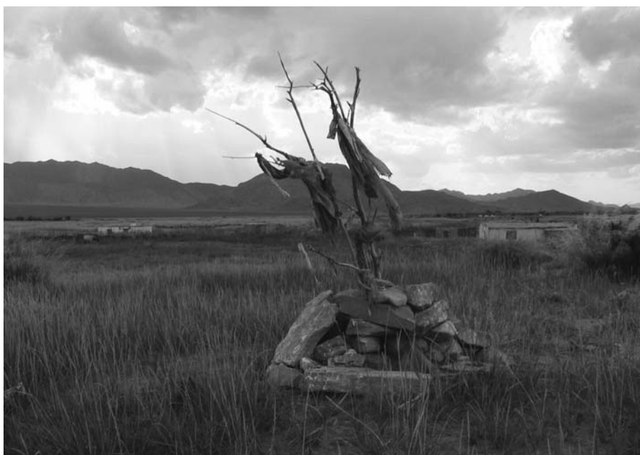
10. 冬营地ヤマント (DM300081(1)、DM300142(2)、DM300115、DM300141(1) など参照)