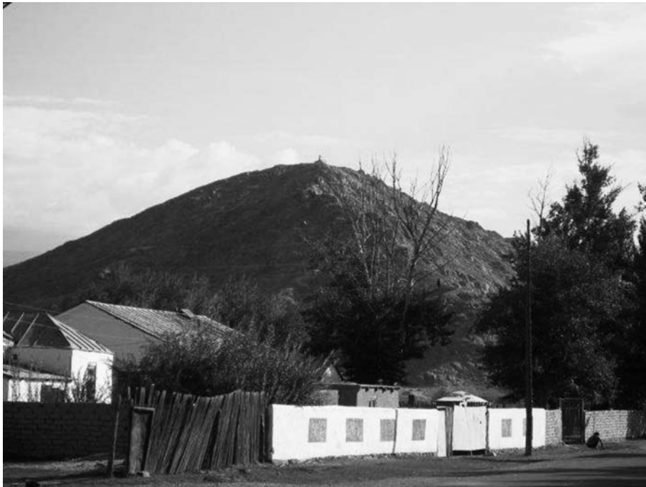
3. ベーリン・トルグードが祭る布林ハイラン山。