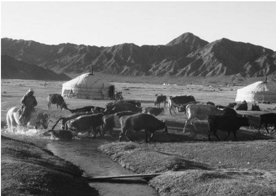
16. 家畜を追い立ててブルガン川を渡る牧民の風景（DM300115参照）。