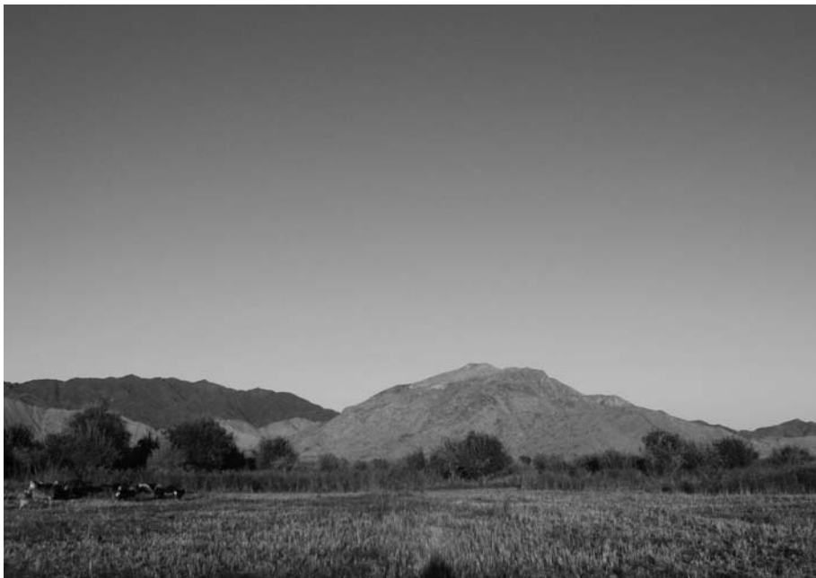
4. バンギン・トルグードが敬うダシワンジル山。