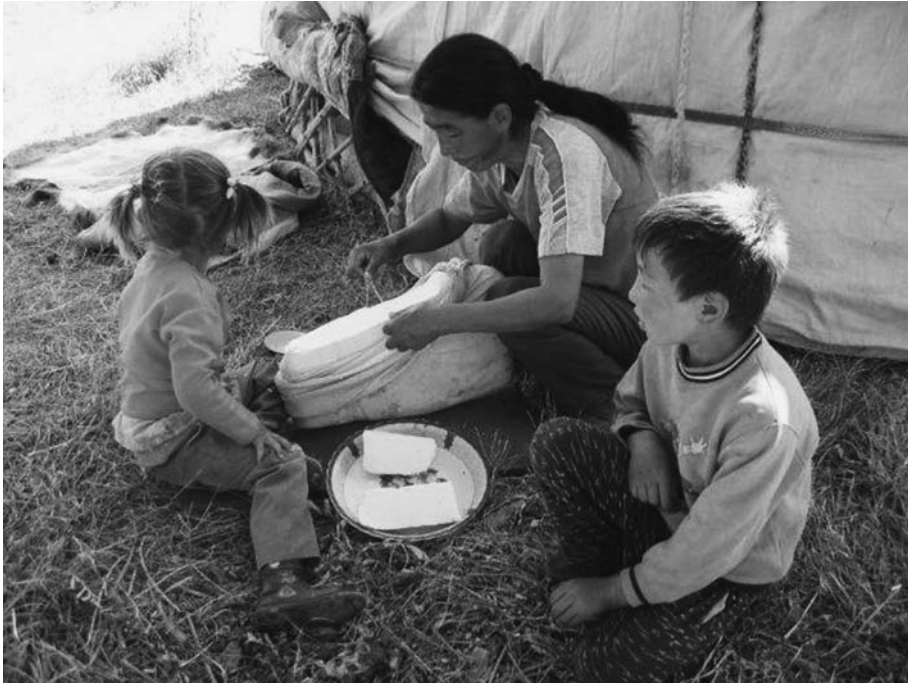
15. ハガルブリ（断片）と呼ばれる大きなヨーグルトの塊（DM300092(1)を参照）。