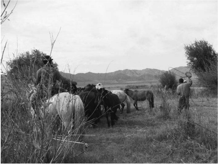
17. 馬を捕まえる風景。川岸に追いつめ、逃がさないように両側に2人が立ち、縄を投げる。