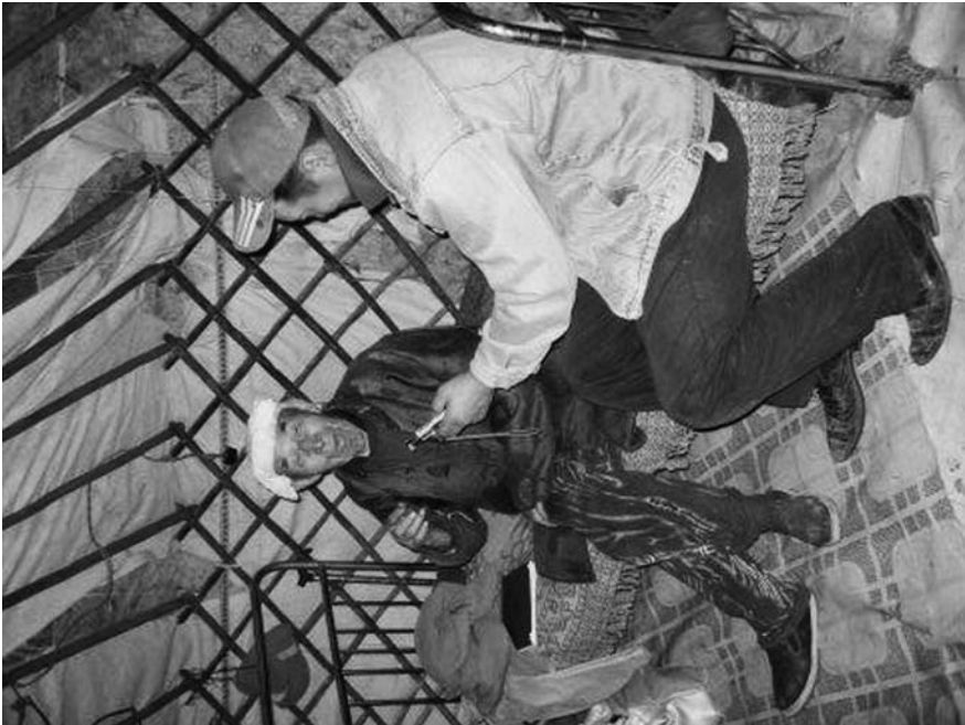
5. ノースタイのインタンビュー風景。