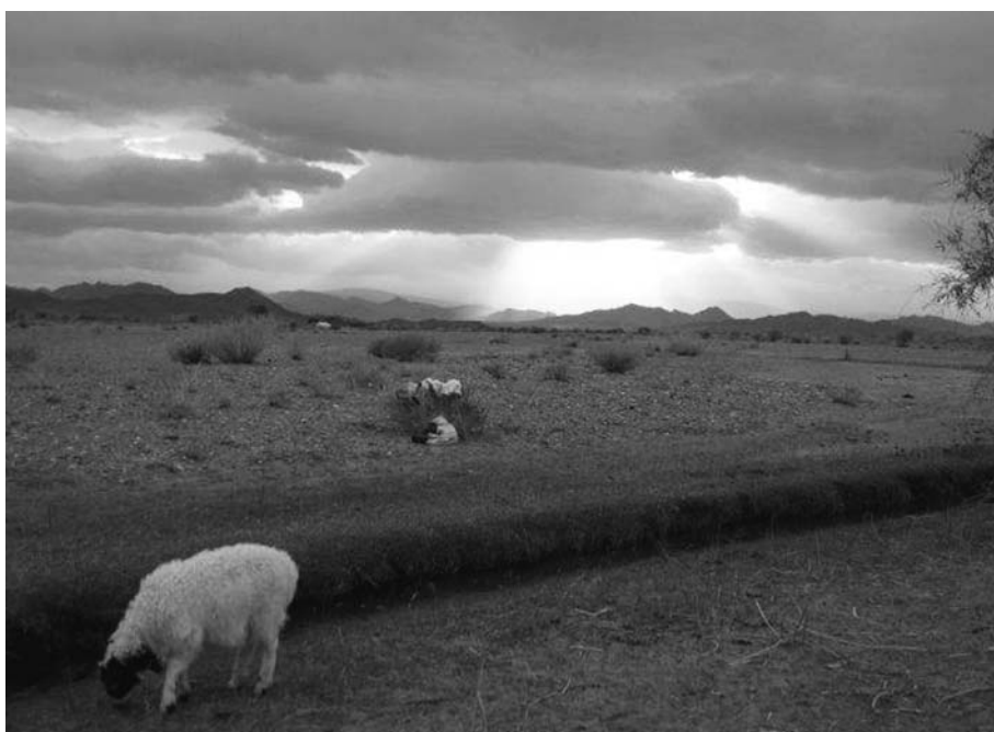
14. ハラガナ (マメ科の灌木) には幾つかの種類がある。これはシャラ・ハラガナ。