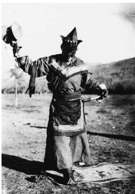
125. Сын шамана Пельже, в традиционном одеянии ламы-джюдиста (последователь одной из школ буддизма). Танну ула, верхний Нарин. Экспедиция 1928 г.