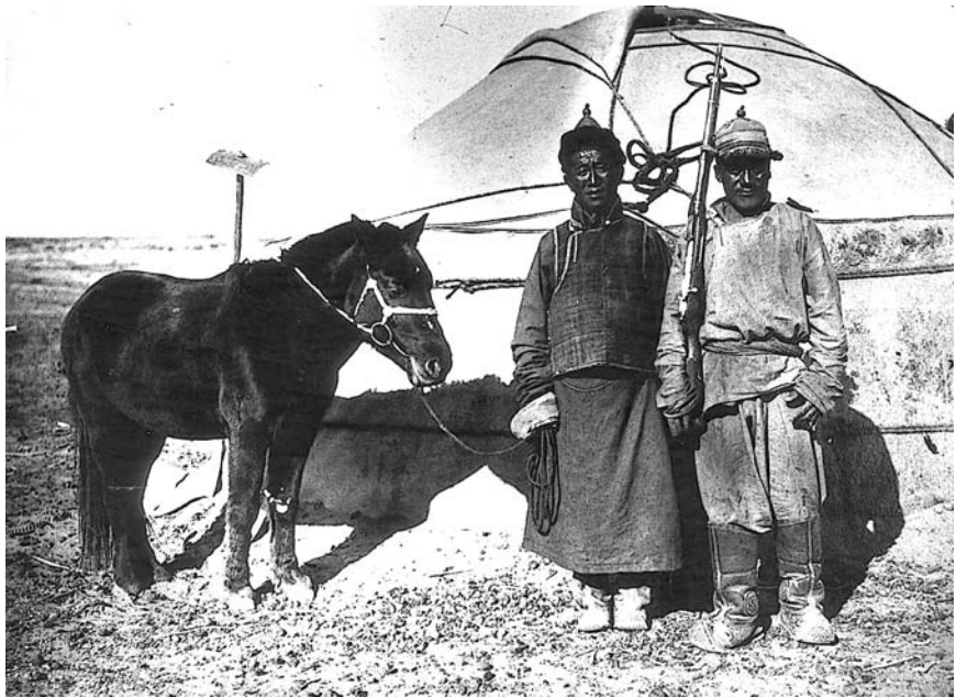
115. Жители окраины Эцин гола: урат (слева) и тангут (справа). Экспедиция 1927 г. (Фото А.Д.Симукова. Фотоархив АН Монголии).