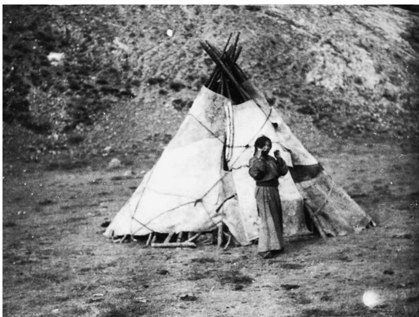
129. Чум зятя шамана Пельчже. Танну ула, верхний Нарин. Хангайская экспедиция 1928 г. (Фото А.Д.Симукова. Фотоархив АН Монголии).