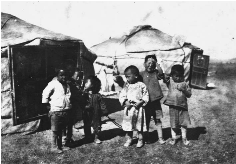
136. Первые жители г. Далан цзадгада. Южно-Гобийский аймаг. 1931 г. (Архив семьи А.Д.Симукова). © Н.А.Симукова