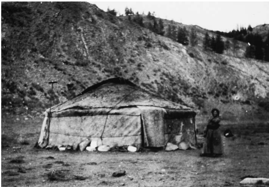
128. Юрта шамана Пельчже. Танну ула, верхний Нарин. Хангайская экспедиция 1928 г.