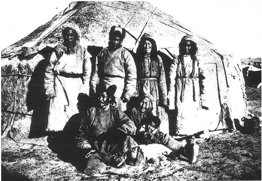
114. Типы эцин-гольских торгоутов. Семья Циндэ. Экспедиция 1927 г.