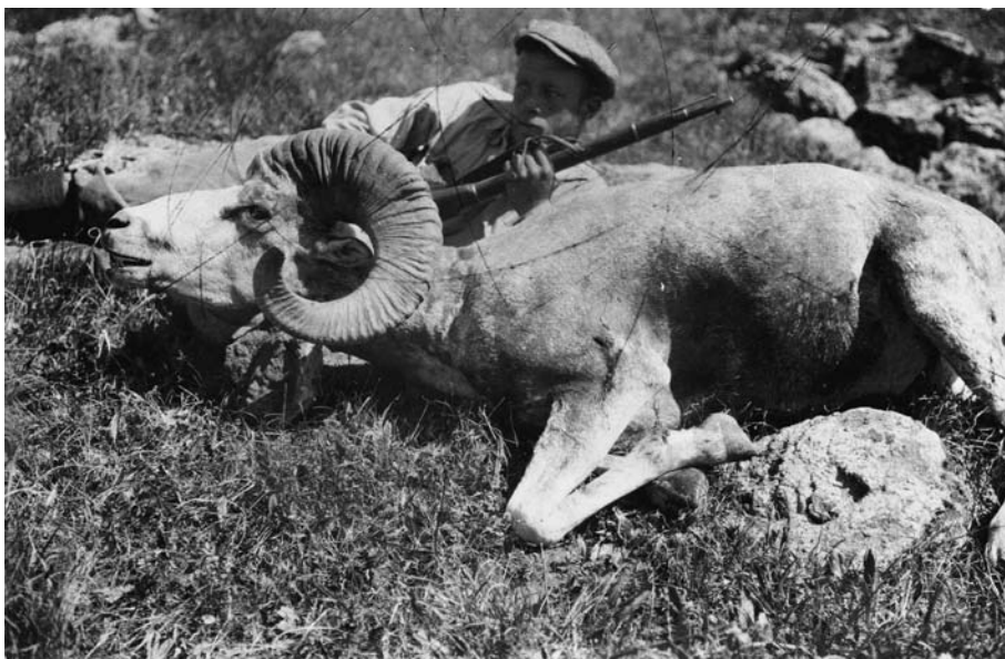
122. Добыча для зоологической коллекции Музея. Хангайская экспедиция 1928 г., вблизи истоков р.Сэнчжит.