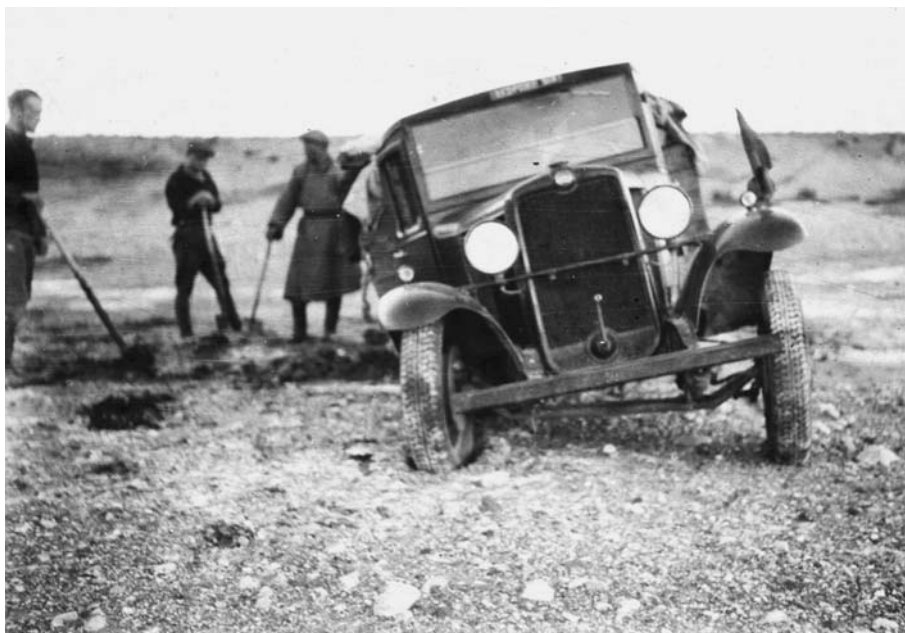
134. Авто «сед». Центральная Гоби. Экспедиция 1931 г. (Архив семьи А.Д.Симукова). © Н.А.Симукова