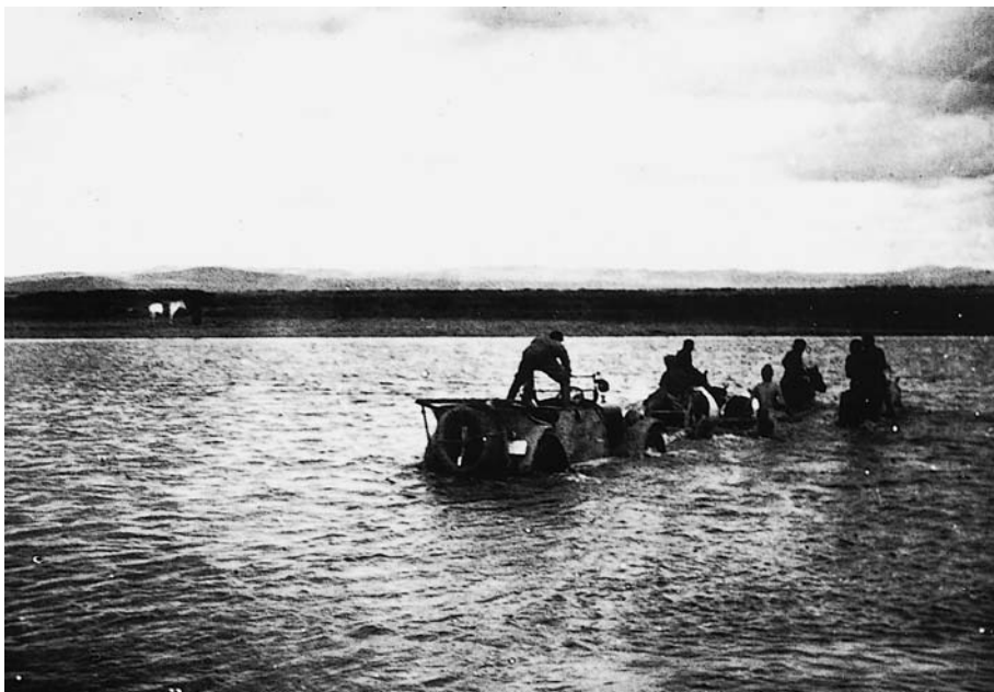
120. Переправа автомобиля через р.Орхон. Хангайская экспедиция 1928 г..