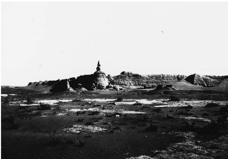
116. Хара хото, вид с северо-запада. Экспедиция 1927 г. (Фото М.А.Симуковой. Фотоархив АН Монголии).