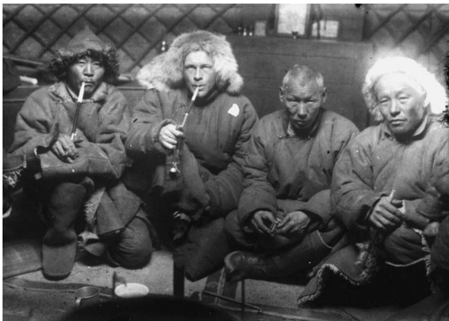
141. В хангайском айле. Экспедиция 1937 г. (Фотоархив АН Монголии).