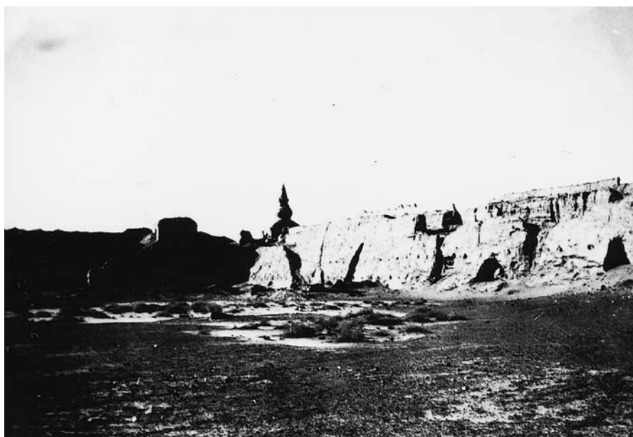
117. Хара хото, северо-западный угол города, вид изнутри. Экспедиция 1927 г. (Фото М.А.Симуковой. Фотоархив АН Монголии).