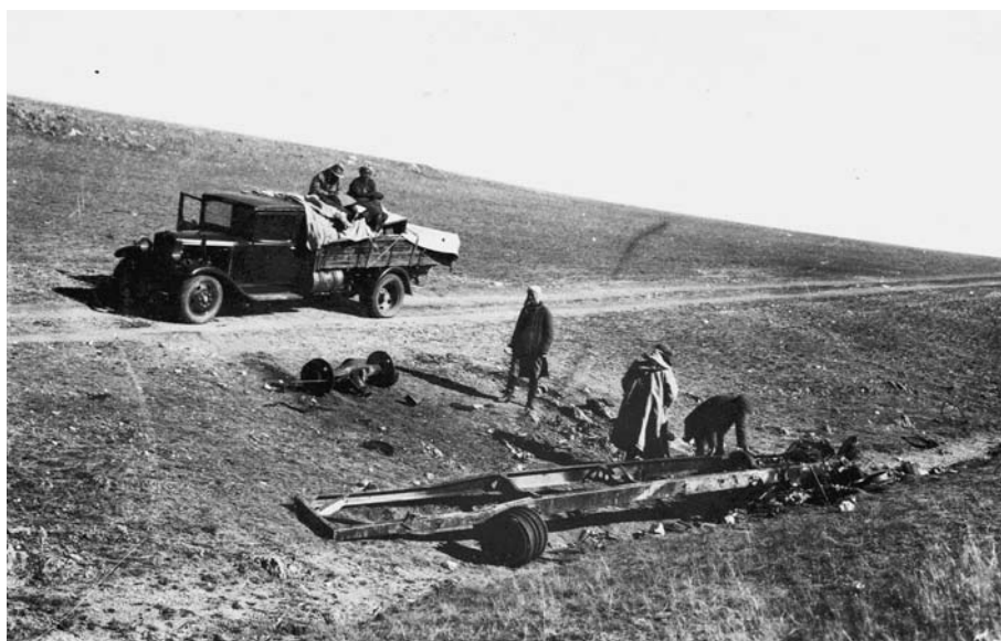
133. Остановка на тракте. Запись расспросных сведений (на машине) и поиски запчастей (у дороги). Экспедиция 1931 г.