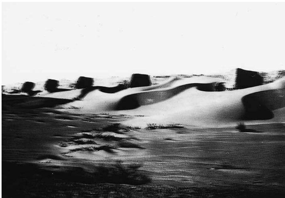
118. Хара хото. Южная стена города, засыпаемая песками. Экспедиция 1927 г. (Фото М.А.Симуковой. Фотоархив АН Монголии).