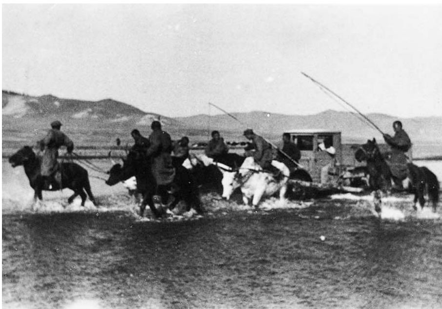
142. Переправа через р.Чулуту. Экспедиция 1938 г. (Фото М.Гомбочжаба. Фотоархив АН Монголии).