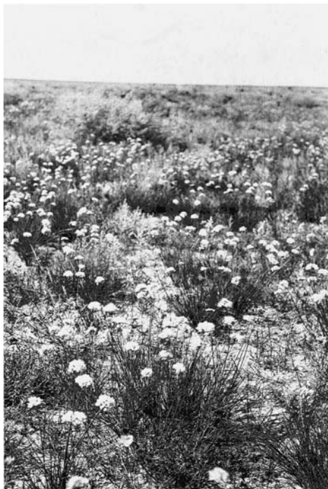
80. Цветущая тана ( Allium polyrhizum ). Восточная Гоби. 1932 г.