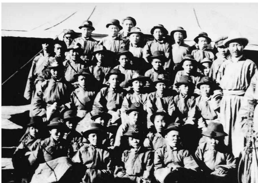
94. Пионеры хошуна Дэлгэр хан ула. Хангайская экспедиция 1928 г. (Фотоархив АН Монголии).