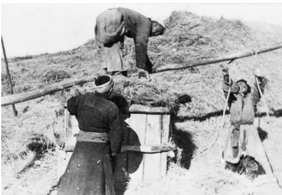
104. Прессование сена на сенокосной станции. Хобдоский аймаг. Экспедиция 1938 г.