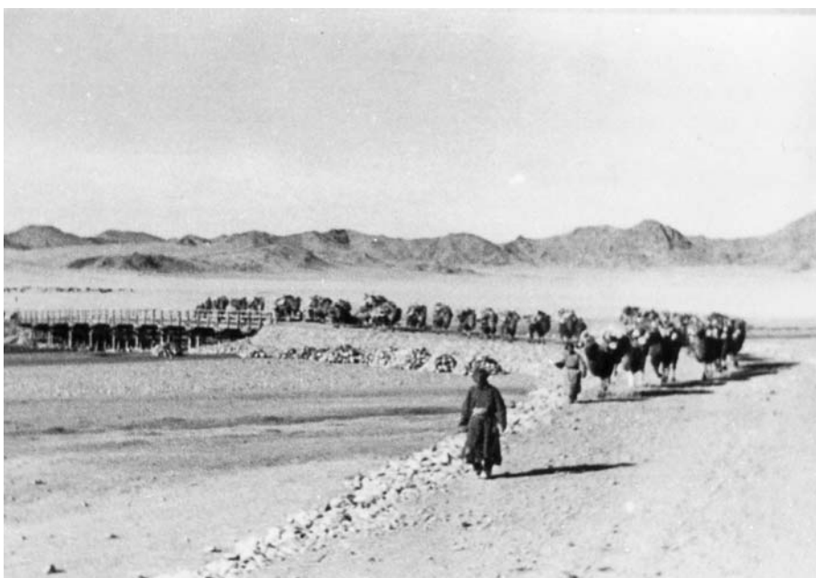
106. Караван идет через мост на р. Буянт. Хобдоский аймаг. Экспедиция 1938 г.