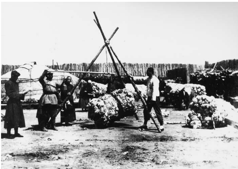
103. Прием шерсти в отделении Монценкопа. Цэцэн хуриэ. Экспедиция 1928 г. (Фото А.Д.Симукова. Фотоархив АН Монголии).