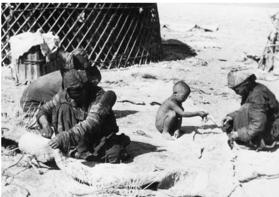
98. Семья за приготовлением материала для юрты. Хуйсийн гоби. Экспедиция 1938 г. (Фото М. Гомбочжаба. Фотоархив АН Монголии).