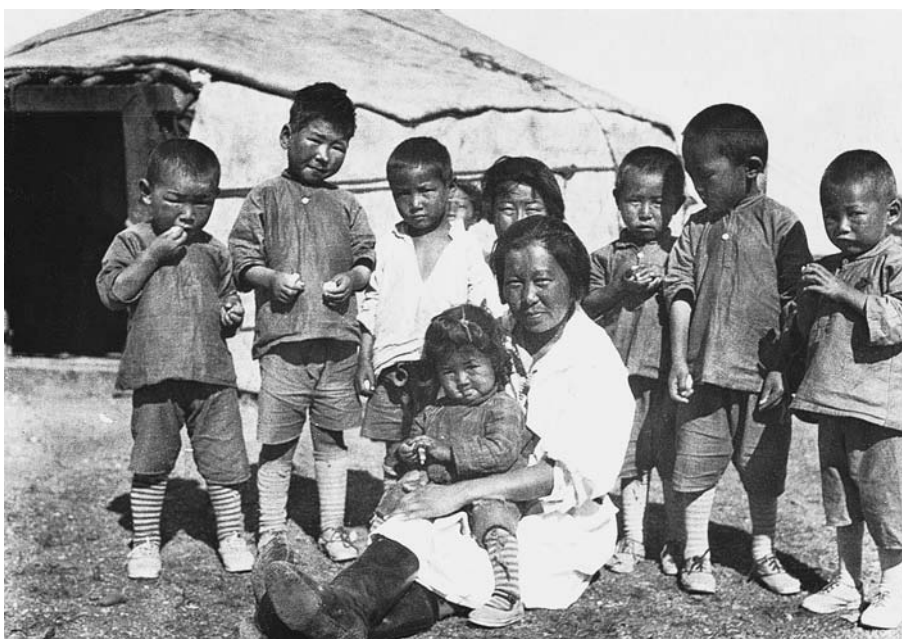
92. Детский сад. Гурбан сайхан. Экспедиция 1931 г.