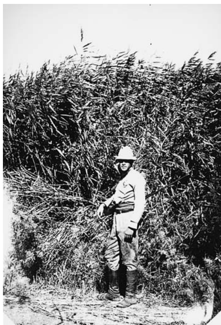
84. Заросли камыша в урочище Шара хулусуун, Цаган богда, А.Д.Симуков. Экспедиция 1927 г. (Архив АН Монголии).