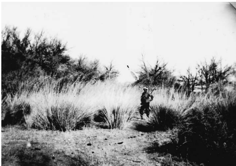
85. Дэрисун, хармык и тополя. Экспедиция 1927 г. (Архив АН Монголии).