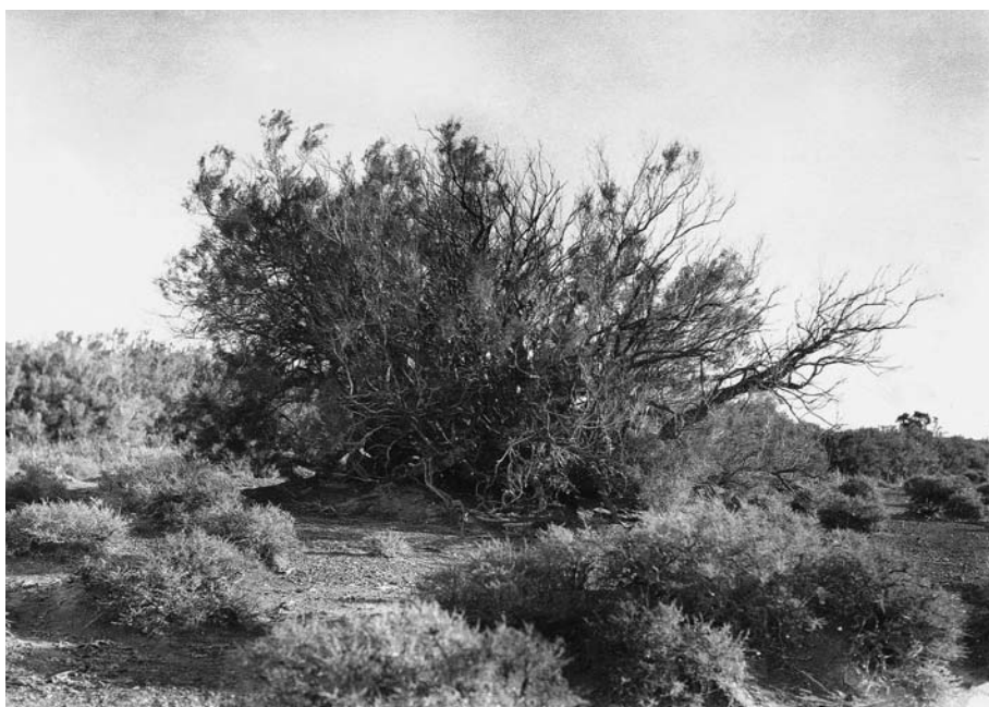
82. Тамариск. Цаган богда. Экспедиция 1927 г.