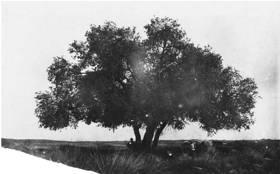
79. Пустынный ильм – хайляс ( Ulmus pumila ). Восточная Гоби. 1932 г.