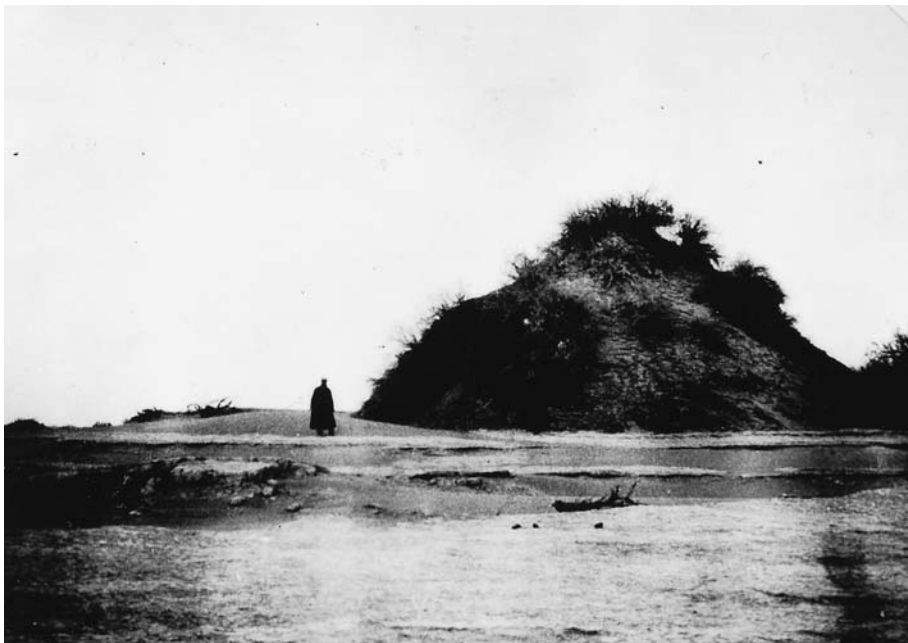
87. Бархан, образованный кустом тamarиска. Окрестности Хара хото. Экспедиция 1927 г. (Фото А.Д.Симукова. Фотоархив АН Монголии).