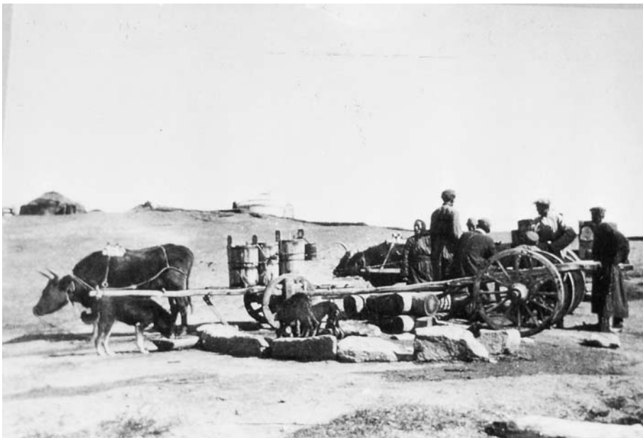
96. У степного колодца. (Фотоархив АН Монголии).