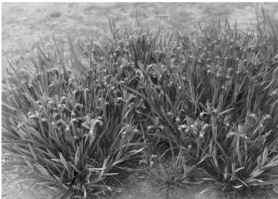
81. Цветущие ирисы в Гурбан сайхане.