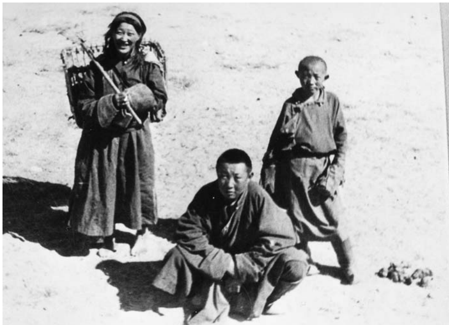
100. Сбор аргала для очага. Южная часть Цзабханского аймага. Экспедиция 1938 г. (Фото М. Гомбочжаба. Фотоархив АН Монголии).