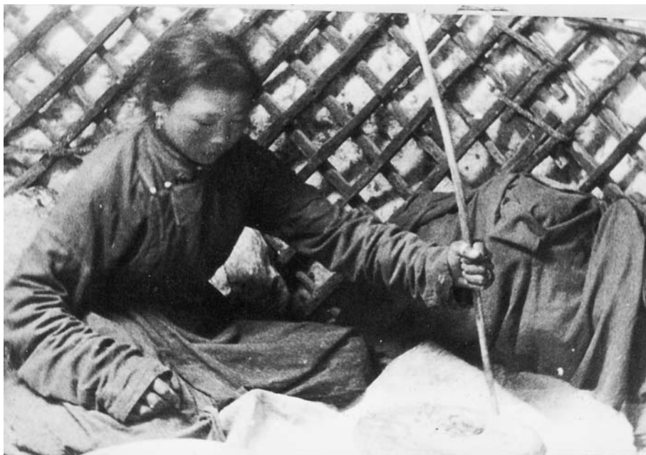
101. Помол пшеницы ручной мельницей. Шаргаин гоби. Экспедиция 1938 г.