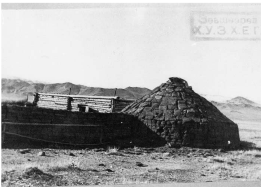
102. Юрта казахов, крытая дёрном, и загон для скота. Экспедиция 1938 г.