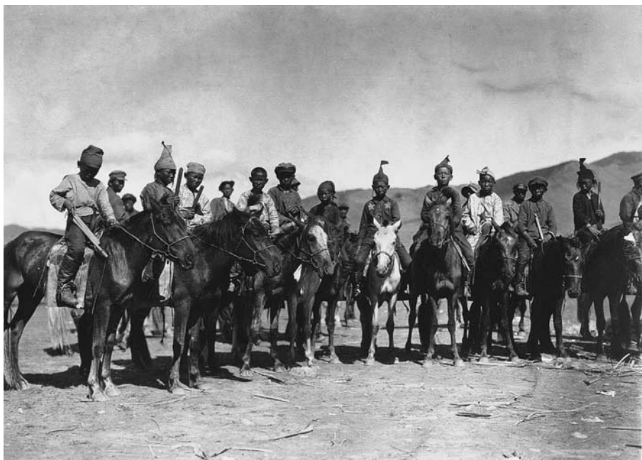
93. Надом. Мальчики-наездники перед скачками.