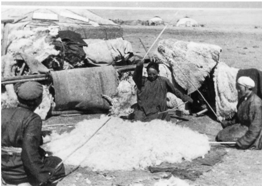
97. Сбивание шерсти для войлока. Хойту Тамир. Экспедиция 1938 г. (Фото М.Гомбочжаба. Фотоархив АН Монголии).