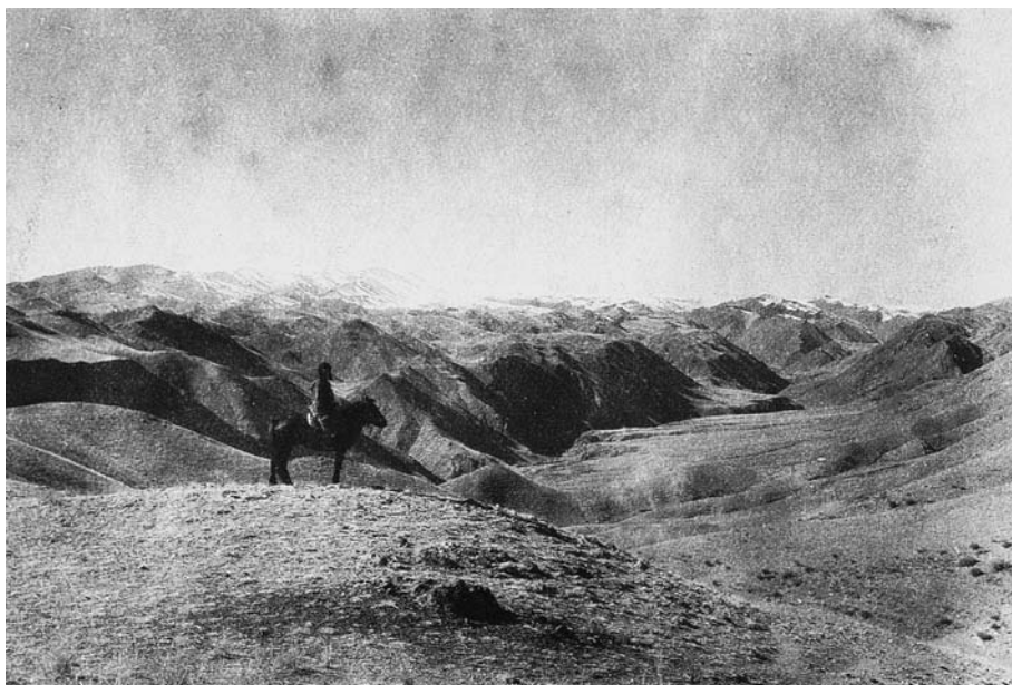
89. М.А.Симукова в разъезде к хр.Баян цаган для сбора укосных площадок. Южная Гоби. Экспедиция 1931 г.