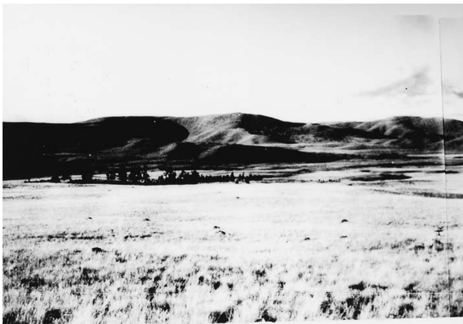
77. Верхний участок долины р. Будун гичигин. Хангайская экспедиция 1928 г. (Фотоархив АН Монголии).