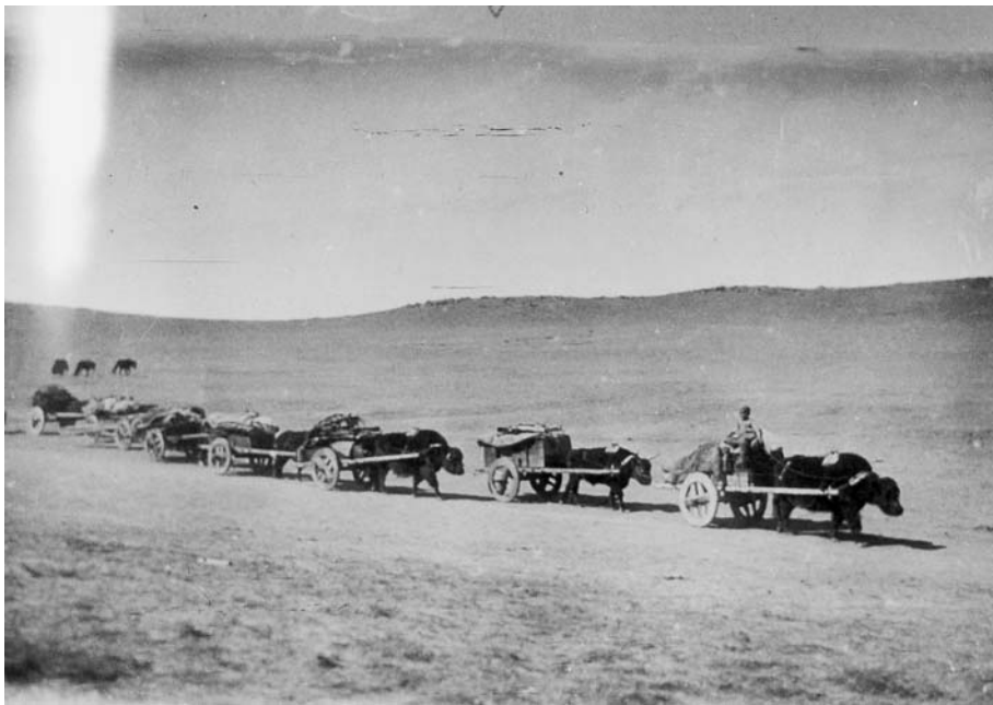
107. Караван сарлочьих упряжек. (Фотоархив АН Монголии).