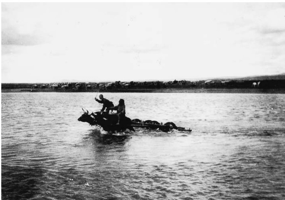
108. Переправа бычьей упряжки. Хангайская экспедиция 1928 г..