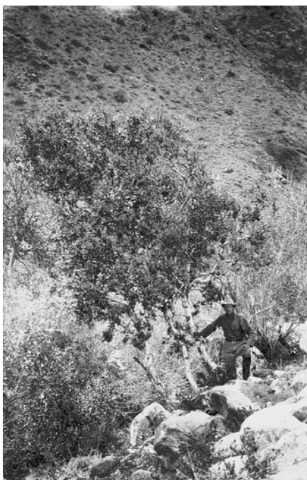
78. Ихэ богда, ущелье Битютэн ама. Березы. Гобийская экспедиция 1927 г.