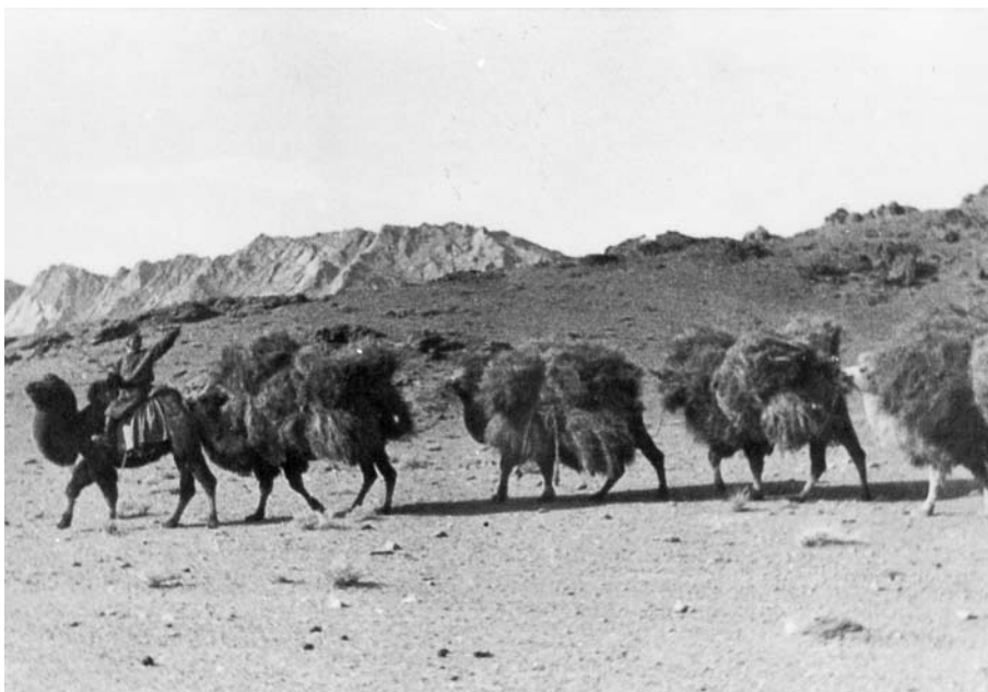
105. Перевозка сена верблюжьим караваном. Хобдоский аймаг. Экспедиция 1938 г..