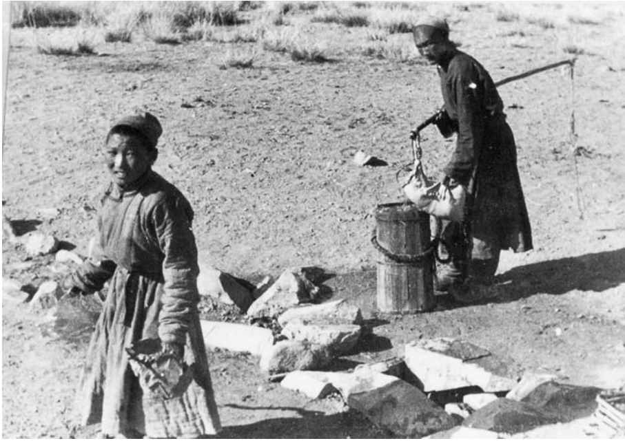
95. Гобийский колодец. Экспедиция 1938 г.