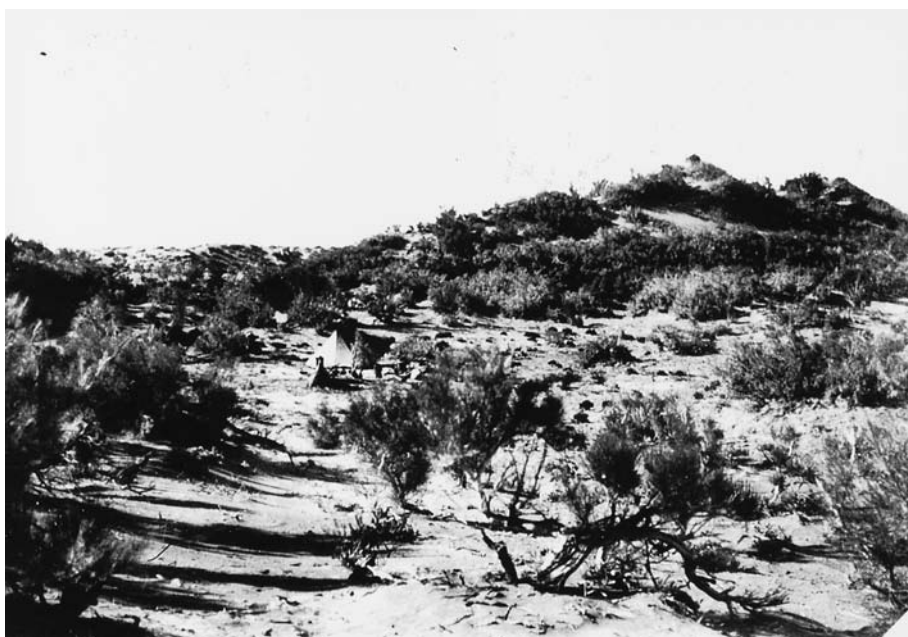
86. Барханы, поросшие саксаулом и тамариском. Урочище Чоноин бом. Экспедиция 1927 г..