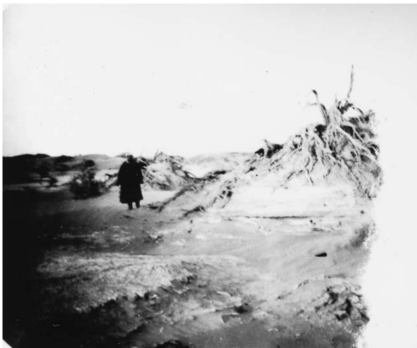
88. Бархан, развеянный ветром, после того, как тamarиск засох. Окрестности Хара хото. Экспедиция 1927 г. (Фото А.Д.Симукова. Фотоархив АН Монголии).