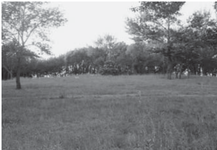
写真24 公園内にあるオボ（2015年8月、筆者撮影）。