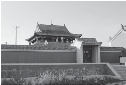
写真26 楊都廟（2015年8月）。

それ以外にも、実は、後から知ったことであるが、アバガ旗には、「チンギス・ボグド・オーラ」のオボや、グンジャブ・オボなど、“知名敖包”リストに入ったオボもあり、この二つのオボは観光化されている。ただし、「チンギス・ボグド・オーラ」のオボの成立の背景には、行政側と民間のモンゴル族の間で攻防があったことを達古拉氏が論じて