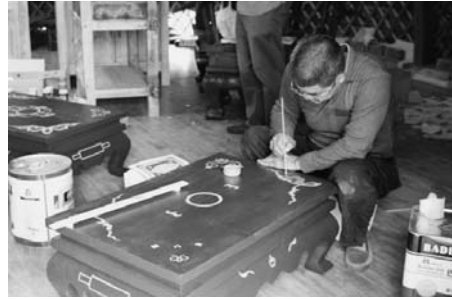
写真8 準備中の野外展示ゲル(2015年8月, 筆者撮影)。写真9 中でモンゴル模様を描き入れる職人(2015年8月, 筆者撮影)。

いう位置づけになっているという 28) 。つまり、観光化による土地の囲い込みによって、オボ祭祀から締め出された人々が集まれるオボ祭祀を、行政側が新たに作り出した、ともいえる。