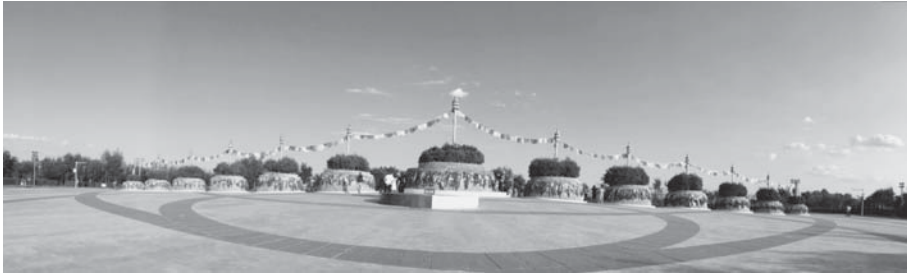
写真10 2004年に復興・新築されたエルデニ・オボ。

したという。エルデニ・オボは中心に大きなオボを配置し、両側にそれぞれ6つの小オボを整列させた13個から構成されるオボである。このオボについては日本でも多くの研究がある。貝子廟の門前町には土産物屋が軒を並べ、その活況を呈している。エルデニ・オボは貝子廟の脇からの通りをとおって、階段を登っていった小高い場所にある。現在は、オボを含む一帯はエルデニ・オボ公園として整備されており、筆者たちが訪れた頃が夕方だったせいもあるが、いかにも観光客然とした人々と同様に、散策を楽しむ多くの市民の姿があった。