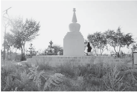
写真13 新しく建ったと思われる白い塔頭（2015年8月）。