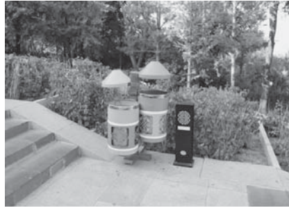
写真14 モンゴル風の模様をあしらったゴミ箱と吸殻入れ（2015年8月）。

オボが2004年に復元された際に、移動され、一時は人民公園にあったらしいが、現在は市内にある烈士陵园に置かれているという情報を得たので、筆者たちはその烈士陵园を訪れた（写真15）。記念碑にはウランフーがつけたという題「革命烈士永遠不朽」とその蒙古語対応訳（bayaturčud ünide balarasi-ügei）が彫られていた（写真16）。1979年9月と刻まれており、厳密には文革時ではなく、文革後であることがわかる。とはいえ、筆者の見たものは1979年のものではなく、実際には新築したものであるらしい。なぜならば、HP上で見た同碑は明らかに異なる形状だからである（写真17）。それゆえ、この1979年に建てられた碑の消息は調査の必要がある。同HPによれば、この英雄碑はエルデネ・