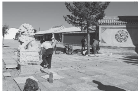
写真6 普会寺門前における整備の様子（2015年8月）。