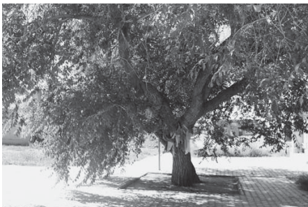
写真5 第六世ゲゲーンの像が復元されてから同様に生き返った境内のご神木（2015年8月，筆者撮影）。