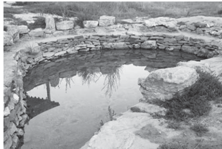
写真25 公園内にある泉（2015年8月、筆者撮影）。

量はたいして多くなさそうであったが、昔はもっと水があったとS教授は言う（写真25）。