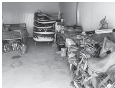
写真30 小屋に保管されている馬具と遊具 (2015年8月)。