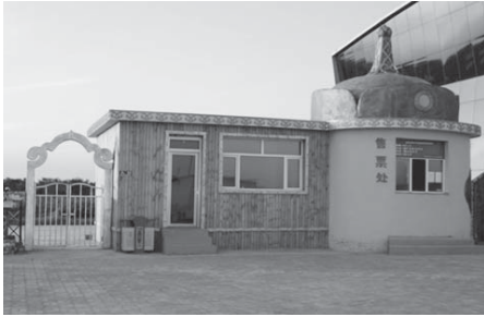
写真22 泉のある公園のチケット売り場（2015年8月、筆者撮影）。