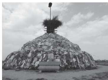
写真2 呼和浩特市の呼和敖包(2015年8月、筆者撮影)。