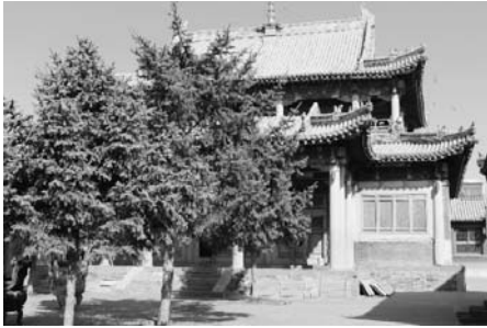
写真18 貝子廟の境内の堂宇のひとつ（2015年8月）。