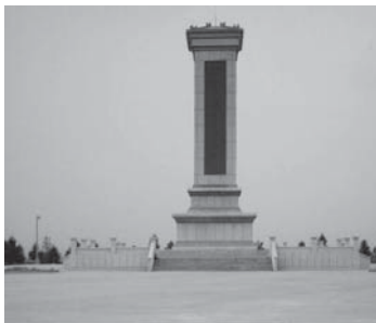
写真17 2015年8月に筆者が撮影した烈士陵园の入り口に建てられた表札（左上写真15）と烈士記念碑（右上写真16）と2000年7月に撮影されたという13オボ跡地の英雄記念碑（左下写真17， http://www.geocities.jp/7 ，2016年12月27日閲覧）。