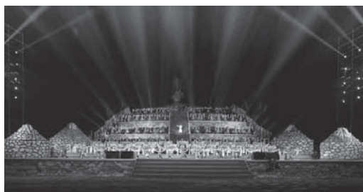
写真1 2016年6月のオールドスにおける式典の一部 ( http://www.newsqq.com/tsyq/2016/7124.html , 2016年12月30日閲覧)。

HP記事では、呼和浩特市の玉泉区にある呼和敖包(フフ・オボ)もその72基の“知名敖包”名簿の中に入ったことが特筆されている。この呼和敖包には筆者も内蒙古大学のオボ研究者のU氏(モンゴル族)に案内されて視察したが、氏の意図としてはこのオボがいわゆる伝統的に祭祀されているオボではなく、現代的な観光用のオボとして筆者の研究資料の一助になるだろうという趣旨から案内されたのであった(写真2) 8) 。同HPではオボの確定作業には研究者が関わったとあり学術性が強調されているものの、たとえば呼和敖包のような新しい観光用オボが著名なオボに入ったことを見ると 9) 、観光を意識して選別されているものが含まれている。内蒙古社会科学院におけるモンゴル語の記事における基準は明確とはいえないが、漢語のHPに記載されている基準をみても、い