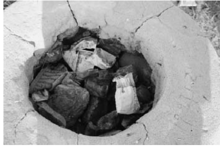
写真21 オボにお参りした痕跡のあるハダクと牛乳袋の残滓 。