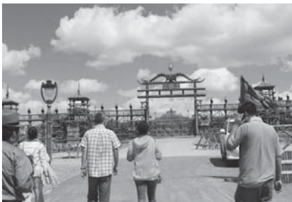
写真3 ホンゴル・オボの入り口（2015年8月）。

この寺はそれゆえにジャサク・ダー・ラマの避暑地であり、シラムレン一帯の牧民はいわば当該寺の俗徒となった。そして、最終的にジャサク・ダー・ラマには軍事的な権限も与えられ政教一致の体制が敷かれることになった [徐・孟克徳力格尔 2012: 195-196; 喬吉（編）1994: 83-84]。民国期においては、1940年に日本の蒙疆政府がシラムレ