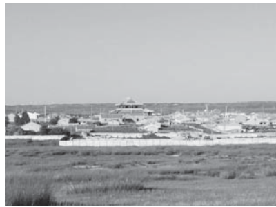
写真27 アルタン・オボからみた楊都廟（2015年8月）。