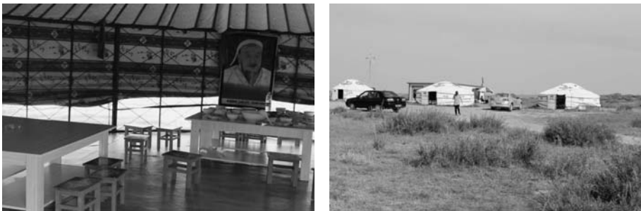
写真32 (左) 観光ゲルのレストラン (右) H氏の観光ゲルの外観 (2015年8月)。