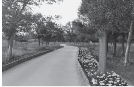
写真23 整備された公園の中の様子（2015年8月）。