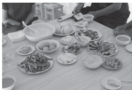
写真29 (左) H氏の観光ゲルの食事 (夕食) (右) 朝食 (2015年8月, 筆者撮影)。