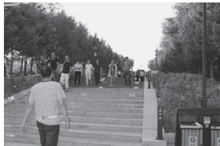
写真12 オボの場所から降りてきた人々で左の建築物は貝子廟（2015年8月）。