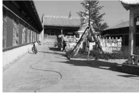
写真19 経を背負って貝子廟の白い塔頭を巡る女性（2015年8月）。