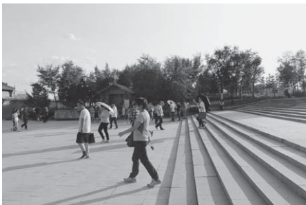
写真11 右手奥に見えるオボに向かう人々（2015年8月）。

地元の人によれば、文革時代には、破壊されたエルデニ・オボの代わりに、バートルーディーン・フシュー（英雄記念碑）が立っていたという。その記念碑は、エルデニ・