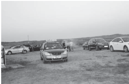
写真28 バーベキューをする人々（2015年8月）。