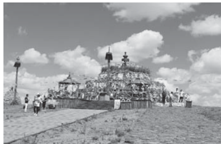
写真4 ホンゴル・オボ（2015年8月，筆者撮影）。