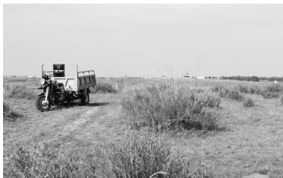
写真33 資源ゴミ回収車 (2015年8月)。