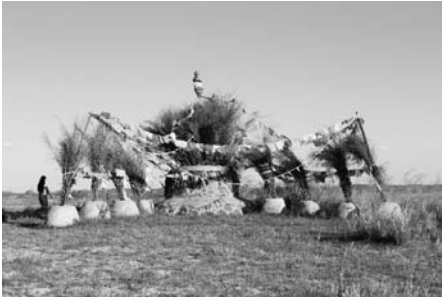
写真20 アルタン・オボ (楊都オボ) (2015年8月)。