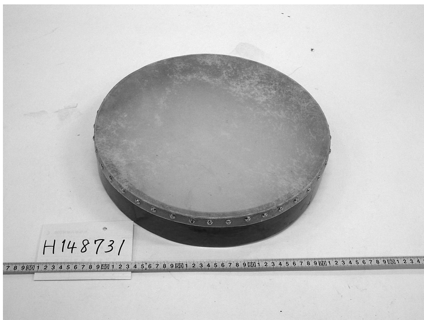
211.311の楽器分類コードをもつ太鼓の例。パキスタンのダフ(民博所蔵)。

楽器分類コードの例をあげてみよう。211.311というコードは、タンバリンのような太鼓を指している。それぞれの数字は左から順に、膜鳴楽器(2)、打奏(1)、直