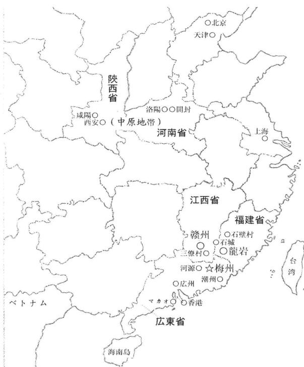
図1：中原と華南地方の客家居住地

周知の通り、今日の中国では風水は公的に「迷信」であるとされており、特定の民族やエスニシティの風水を殊更強調する研究は稀である。