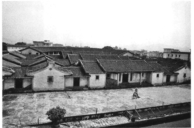
写真1 囲龍屋の全体写真

図2を見れば分かるように、囲龍屋の内部には複数の部屋があり、全体的に楕円状になっている。中堂間、横屋間、囲龍間には、伝統的には同じ宗族の者が居住する。囲龍屋は、規模が大きければ三〇〇余名、規模が小さくても数十名の者が住める構造になっている。