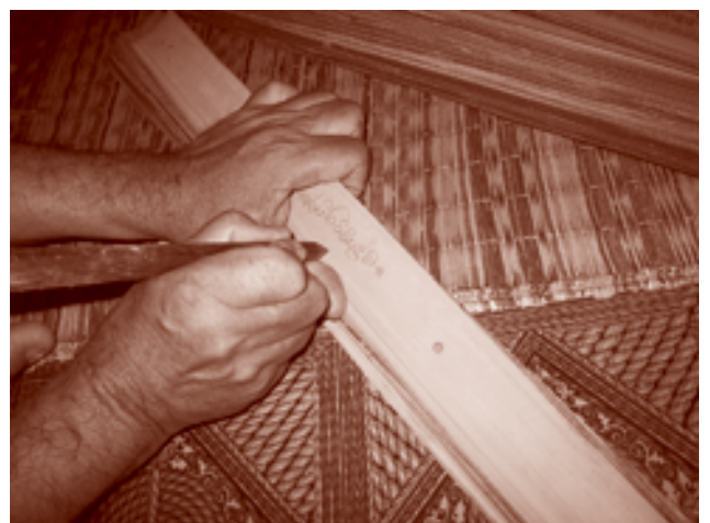
デーヤイ村の寺院には100巻程度の貝葉が残されているが、2001年当時この文字を読むことが出来るのは70代の僧侶1人だけ（9名の僧侶が在住）。1999年に96歳で他界した僧侶はタム文字だけでなく、タイノイ文字、コム文字にも堪能であった。写真は古い貝葉を写しているところ。若い僧侶たちはこの文字に関心を持たないので、読み書きを教授することはまったくない。 タイ、コーンケン県ムアン郡デーヤイ地区デーヤイ村 2001年9月、撮影者：津村文彦

たとえば、タム文字は、13、14世紀に伝播したパーリ語仏典を記すために用いられてきたモン系統の文字である。この文字は、東北タイ、北タイ、西北ラオス、シャン州、西南中国の一部までの連続する広い地域に、パーリ語仏典の写本とともに分布している。写本は、貝葉と呼ばれるタラバヤシの葉を書写媒体に、鉄筆で刻んで記されている。