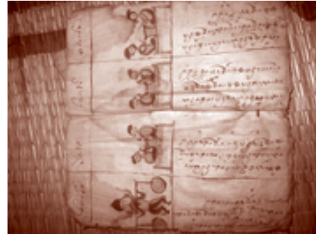
日相をみるための占ト書『バップ・ム』。 ベトナム、イエンバイ省ヴァンチャン県ギアロ 2004年2月、撮影者:櫻永真佐夫

しかし、東北タイでも国家文字の普及とともに、タム文字を読み書きできる人は減ってきた。そうした中、近年、貝葉写本に代わって、貝葉の印刷本が出版されるようになり、ローカルな知識人や職業研究者がタム文字への関心を高めている。