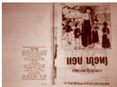
西北区教育局出版から1966年に出版されたタイ語講読の教科書のコピー。タイ文字は印刷字体風だが、実は手書き。白黒ガリ版刷り。ハノイにて6000冊印刷されていることが、左頁（表表紙の裏面）に記されている。 ベトナム、ハノイ国家図書館所蔵 2006年3月、撮影者：櫻永真佐夫

慣は、黒タイの領土と歴史に関する社会的な記憶を、繰り返し人々に刻み込む役割を果たした。その意味で、この年代記は、黒タイという集団のメンバーシップと分布域を規定する政治的作品でもあった。