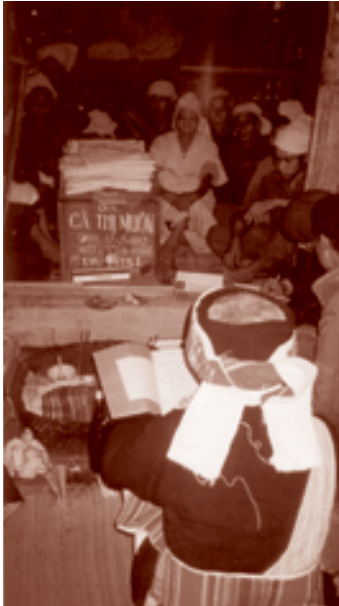
葬式での『クアム・トー・ムオン』の読誦 ベトナム、ディエンビエン省トゥアンザオ県 1997年11月、撮影者:櫻永真佐夫