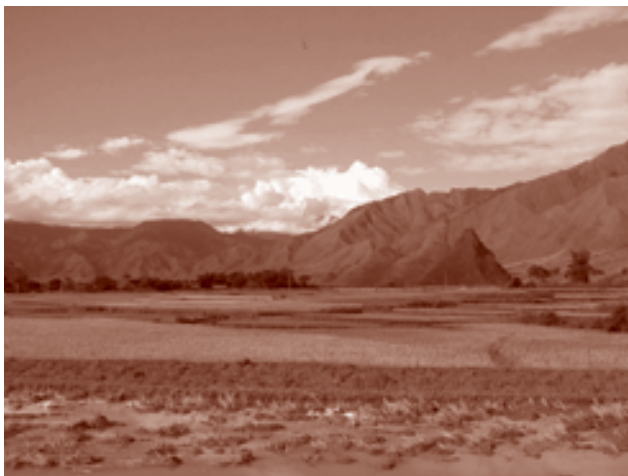
黒タイが居住する盆地風景 ベトナム、ライチャウ省タンウエン県。 2002年6月、撮影者：櫻永真佐夫

20世紀の国民国家化を経て、東南アジア大陸部北部は、中国、タイ、ラオス、ミャンマー、ベトナムといった、複数の国家に領土分割されている。その結果、西南中国では漢字、北・東北タイではタイ文字（シャム文字）、北部・中部ラオスではラオ文字、ミャンマーのシャン州ではビルマ