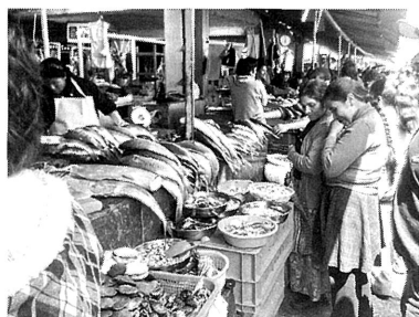
下/手に売り物のサメが見える(ペルー北高地カハマルカ市)

献に記されている。聖週間は、キリスト教の教会暦における四旬節の最後の週、すなわち受難の主日からの一週間をさし、とくに金曜日はキリストが磔刑にあつた日とされる。物忌みのために肉食を避ける習慣がキリスト教圏に多く、植民地時代以来カソリックが深く根付くペルーでは、聖週間は現在でも大きな意味を持つ。もともと現在の聖金曜日には、魚のトウガラシ煮込み(ピカンテ・デ・ペスカード)を食べることが多いようだ。干したタラなどが使われ、ニンジン、タマネギ、ジャガイモと一緒に煮込む。干したトウガラシを加えることで汁に赤味をつけるが、もしかすると、この色づけは、キリストの死を表象しているのかもしれない。