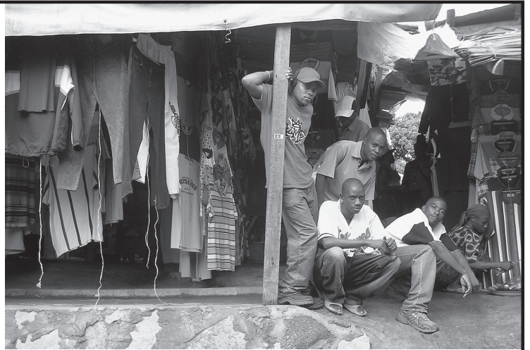
ムランゴ・ムモジャ古着市場 (2004年、タンザニア)。

第2のセッションは視線を20世紀～現在に向け、東アフリカでの布の輸入、インドにおける中古衣料の輸入と再生毛布としての輸出に焦点を当てて、繊維・衣料をめぐるグローバルな市場のダイナミクスが論じられた。かつてイギリスにあった再生毛布製造の中心は、いまやインドに移っている。その工場の中古衣料を裁断し機械にかけて働く女性たちの労働と語り映し出された最新の映像作品も、発表とともに上映され、中古衣料が手仕事と機械で毛布にリサイクルされるさまは、参加者に圧倒的な印象を与えた。また東アフリカにおいても、植民地宗主国による消費市場支配の意図が、現地