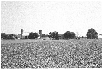
ランカスターの風景

アーミッシュに関する不正確な記述を防ぐため、インタヴューに積極的に答える者も現れた。一九八四年のパラマウント映画「目撃者 Witness」に関しては、麻薬犯罪にアーミッシュが巻き込まれたという設定に対し、代理人を州議会議事堂に派遣して正式に抗議している。ツーリズムのプロレシヤーに対しアーミッシュは他の問題への対応と同様に方策を講じ、その過程でアイデンティティを明確にしてエネルギーを蓄積したようにもみえる。実際、アーミッシュに関する情報が蓄積されるにつれ、教育や宗教に関する