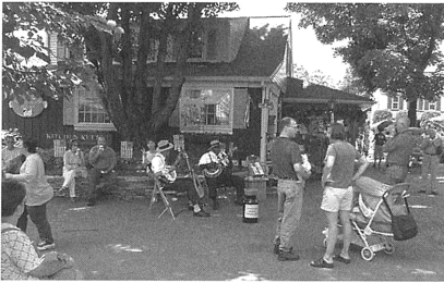
ランカスターのアーミッシュの観光地

ヨーロッパから移民したアーミッシュは現在アメリカ大陸のみで生活している。ここにはユートピアとしての活力が隠されているのかもしれない。アメリカ医学社会史において注目される「植物治療運動」は、一九世紀半ばの医療専門職化に抗し、アメリカ自生の薬用植物（ロベリア）の有効性を知るふつうの人々（ordinary people）が家族や近隣の者と協力して治療にあたることを訴えたニュー・ハンプシャー州の一農夫に率いられたものである。治療は料理と同じものであり、「セルフ・ヘルプ」というアメリカの伝統を手放すまいと主張したこの運動は、フロンティアに広がりオハイオ、インディアナなどで信奉者を集めた。「幸せ well-being」とはなんなのか。何を選択しなにかを諦めるのか。後戻りできない人生を歩みつつ私たちはこれからも問い続けるのだろうか。