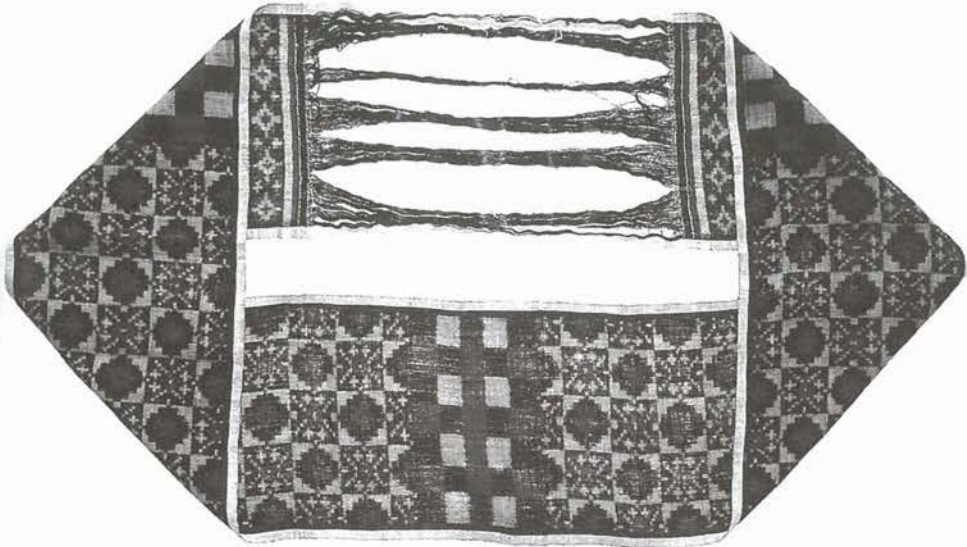
輪状織物：トウンガナン・ブグリンシンガン村のタテヨコ緋（インドネシア、バリ島）

織りあがった織物のかたちは、幅や長さが違ってはいてもすべて四角形であると思っていた。しかし、事実はそうではなかった。織りあがりの織物のかたちが、必ずしも四角形とは限らないということを知ったのは、先月