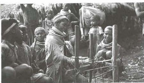
ボンダ人による輪状織物の機織り (インド、オリッサ州：1979年)