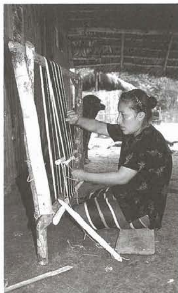
ツアトゥチェラ人による輪状織物の機織り (エクアドル、ピチンチャ州：2000年)