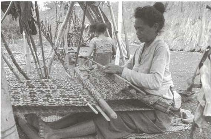
アト二人の腰機による輪状織物の機織り（インドネシア、ティモール島：1972年）

輪状織物を織るアト二人の腰機の基本構造 a-先端棒、b-先端棒保持具（杭）、c-手元棒、 d-腰当、e-綜絨、f-開口保持具（中筒）、 g-緯打具