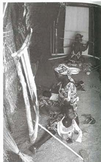
フルベ人による輪状織物の機織り (カメルーン、ミンディフ：2000年)