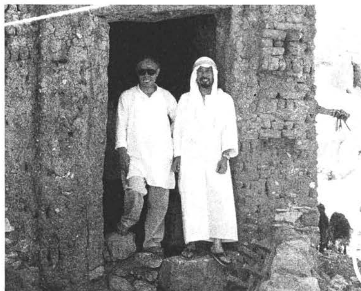
エジプト、ルクソールにて (1997年、右が筆者)

この1970年のティモール島を皮切りに、今日に至るまで、わたしはテキスタイルの現場を走り回りながら、フィールドワークを続けている。調査地はしばらくはインドネシアが中心であった。その間の主な成果には、『インドネシア染織大系』(上巻/1977年、下巻/1978年、紫紅社)、『インドネシアの金更紗』(1990年、講談社)、『ジャワ更紗』(1996年、平凡社)などをはじめとする著作、インドネシアやインドの染織を取り上げたいくつかの展覧会の企画監修などがある。従って、わたしの専門については、一般にはインドネシア染織、あるいはジャワ更紗やイカットの専門家として、ご理解をい