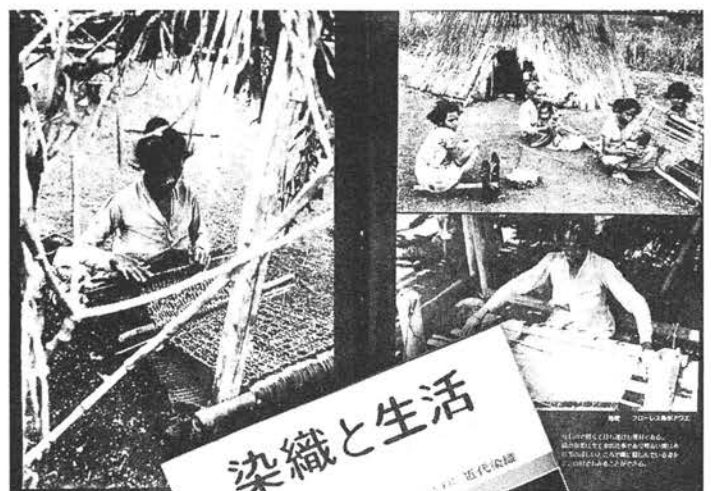
初めて原稿を書いた『季刊染織と生活』創刊号のグラビアと表紙・題字

わたしが初めて執筆した原稿は、創刊号の冒頭を飾るグラビア(特別ルポ・南方染織の源流を往く―インドネシア東方の島々―)と、連載となつた本文中の記事(特別ルポ・イン