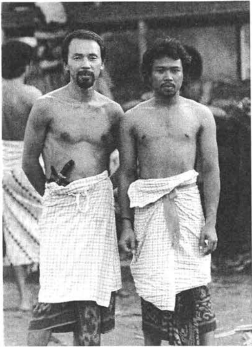
バリ島トゥンガナン村にて (1981年) (左が筆者)

000キロメートルの小さなティモール島に出掛けたのは、芸大で探検部に所属し、工芸科染織専攻の学生であったことが関係している。また、行き先をティモール島としたのは、大学の図書館から探し出した、当時としては珍しいインドネシアの島々の伝統的なテキスタイルを紹介した『南方染織図録』(京都書院1959年)の中に、イカットと称する緋織物を見だし、それらが作られた現場のうちでは、ティモール島が最も行きやすいと思われたからである。