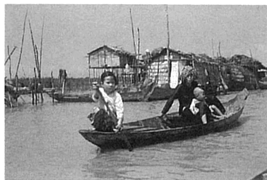
1957年、カンボジア王国トンレサップ湖上のクメール族。第一次大阪市立大学東南アジア学術調査隊（1957年11月～1958年4月）の隊長として調査。