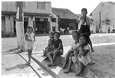
1958年、ラオス王国（当時）ターケーにて。第一次大阪市立大学東南アジア学術調査隊（1957年11月～1958年4月）の隊長として調査。

これら写真コレクションの中で、35,000点に及ぶ、初代館長梅棹忠夫の写真コレクションは、1940年～1986年にわたり世界各地を調査した貴重な資料です。ちなみに梅棹忠夫は、岩波写真文庫から『アフガニスタンの旅』（1956年）など写真集3冊を刊行、1973年に日本写真家協会に入会、それが縁で1982年から2010年にかけて国内各地で写真展「民族学者 梅棹忠夫の眼」を開催するなど、芸術性も重視した写真家としても知られています。各地域の人びと、特に子どもたちの写真に味わいがあります。