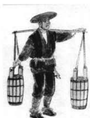
両天秤で売り歩く水売り。

このようにグローバルなペットボトルの普及は、自然科学と人文社会科学にまたがるさまざまなテーマをはらんだ現象である。それを考えるきっかけを企画展でも見つけていただきたい。