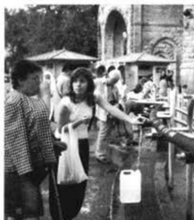
プラスチック製の容器につめ「聖水」 をもちかえる人びと。ルルド