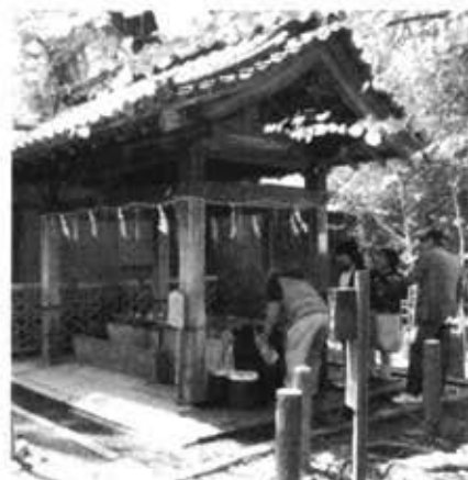
京都三名水のひとつ、「染井の水」。 最近ではペットボトルを利用する姿が 目立つ。梨木神社