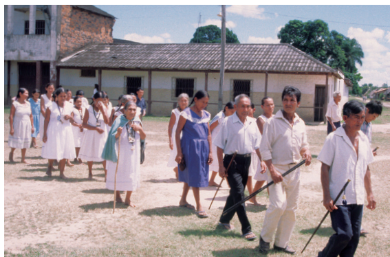
ボリビア東部低地の町のカビルド役人と信心講成員。共同体自治は今日の先住民社会に深く根づいている。

スペインが海外拡張を遂げた時代は、近代国家建設の時代でもある。強大な軍勢力、豊富な経済力、発達した官僚制を備えた王権が領域全土に実効支配を及ぼしていきのだが、従来の研究では、王権の伸張にともない都市や町などの自治共同体は弱体化していったといわれていた。しかし、近年の研究では、スペイン王権が実は共同体自治を促進し、集権化ではなく分権化により王権を強化するという、一見して逆説的な政策を実施