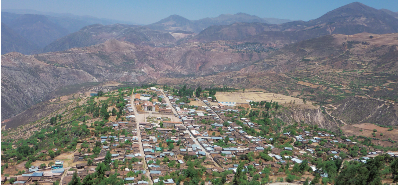
ペルー中央山岳部の町。町の創設はスペイン統治時代にさかのぼる。広場に沿って街路が並行して走っている。

機関研究 ● 「包摂と自律の人間学」領域 近代ヒスパニック世界における国家・共同体・アイデンティティ——スペイン領アメリカの集住政策の研究 (2011-2013)