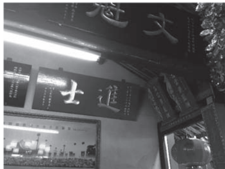
写真11 祖先の功績を飾った扁額