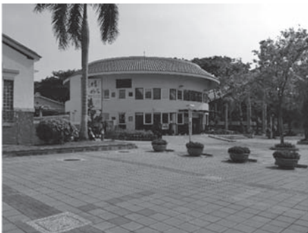
写真5 高雄市新客家文化園區のレストラン

さらに、円形土楼を模した近代建築は、台湾や東南アジア諸国にも拡大している。台湾では、特に1980年代後半に客家権利主張運動が高まってから、円形土楼が客家文化のシンボルとみなされるようになった。その後、21世紀に入ると、もともと土楼文化圏ではなかった台湾の各地で、円形土楼を模した建築物が建てられるようになっていく。例を挙げると、新竹市竹北鎮の国立交通大学客家文化学院、苗栗市高鉄駅付近の観光サービスセンター、台中市東勢区の高等専門学校、高雄市新客家文化園區のレストランが、円形土楼型の建築物を模している。また、ここ数年、マレーシアとインドネシアにおいても円形土楼を模した建築物が次々と建てられるようになった。マレーシアでは、華人人口のなかで客家が過半数を占めるサバ州のコタキナバルにおいて、円形土楼型のレス