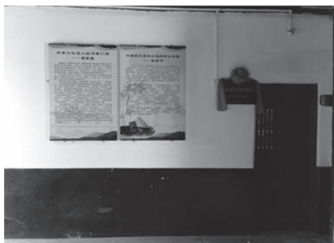
写真12 囲龍屋内のミニ革命記念館

もう1つは、共産党革命に参加した一族の成員（將軍）を記念する部屋を囲龍屋の一室に設置し、彼の写真や遺物をミニ革命記念館として、そこに展示するようになった。これは、客家が愛国主義精神を強くもつとする言説を体現するとともに、共産党のイデオロギーに迎合することで、囲龍屋を破壊から免れるようにしようとするものであるといえる。