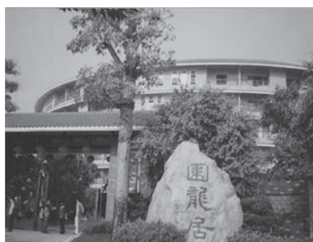
写真8 円形土楼型のマンション

このように梅県では近年、外部者の客家イメージに合わせながら景観を建設するようになってきている 6) 。また、地元政府は、文化的景観の建設を通し、梅州市が客家空間であることを視覚的に示し、外部者の観光・投資行為を誘致したり、内部者の客家意識を高めたりしている。その結果、梅州市が広東省で最も観光収益をあげている地区の1つとなっていることにみるように、政府や開発業者などによる客家文化政策や景観の建設は一定の効果をあげているとすることができるだろう。しかし、上述したように梅県における景観の建設は、外部者にとっては「客家らしさ」を感じるものになっている反面、もともと梅県には存在しなかったか少なかった文化的要素までもが組み込まれている。したがって、地方政府の主導で建設されてきた景観は、時として地域住民が思い描く景観とは異なるものになっている。次に、地域住民による景観への認知と実践についてみていくとしよう。