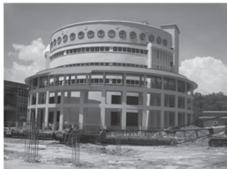
写真6 コタキナバルの客家レストラン