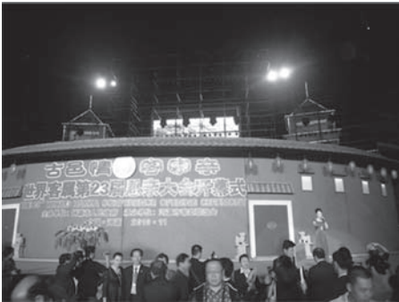
写真3 河源市客家文化公園の土楼建築

家のシンボルとして、土楼文化圏ではない地域で建設され始めるようになった。管見の限りにおいて、梅県のほか、広東省河源市、江西省贛州市、四川省成都市で円形土楼を模した建築物が建てられている。そのうち、河源市と贛州市では、テーマパーク内に円形土楼を模した建築が新たに建てられた。成都市では、郊外に位置する洛帯鎮で円形土楼を模した建築物が建てられ、現在は博物館として利用されている。