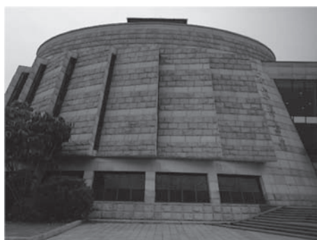
写真7 客家公園の中国客家博物館

畑を開発し、そこにホテルや茶摘みなどのリゾート地を建設した。このホテルは、円形土楼の形を模してつくられており、さらにホテル内のレストランでは客家料理や客家歌劇を提供するなどの、文化的景観が創造された。続いて2005年3月より梅県の中心地で客家公園の建設が進められたが、公園入り口の門および公園内の中国客家博物館は、円形土楼のデザインに基づき建設された(写真7)。また、2006年3月には、梅江区の西南端に客天下リゾート地が建設され、円形土楼型のレストランのなかで客家料理が提供されている。さらに、梅県新城では、他にも円形土楼型のマンション(写真8)や体育館が建設されるなど、円形土楼を使った景観が次々と建設されている。