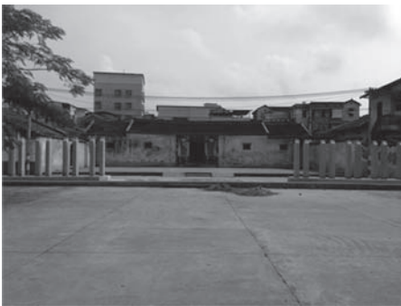
写真10 囲龍屋の前に建てられた眉杆

一つは、祖先の功績を称える眉杆および扁額の建設が加速したことである。2013年になると、梅県政府は「客家らしい」景観の建設を促進するため、各宗族に対し眉杆を立てることを推奨するようになった。これを受けて、X宗族では、文化財に指定された囲