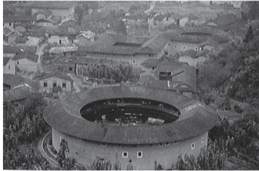
写真1 円形土楼と方形土楼

そのうち見た目のインパクトが強く、客家のシンボルとみなされているのは円形土楼の方である。アメリカ合衆国のニクソン大統領が人工衛星を飛ばした時、人工衛星に撮影された画像を見て、円形土楼をミサイル発射基地と誤解したという、逸話も残されている。