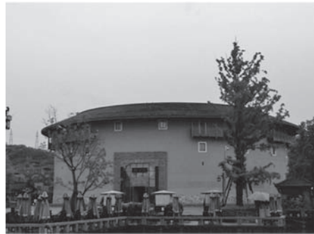
写真4 四川省洛帯鎮の土楼建築

さらに、円形土楼を模した近代建築は、台湾や東南アジア諸国にも拡大している。台湾では、特に1980年代後半に客家権利主張運動が高まってから、円形土楼が客家文化のシンボルとみなされるようになった。その後、21世紀に入ると、もともと土楼文化圏ではなかった台湾の各地で、円形土楼を模した建築物が建てられるようになっていく。例を挙げると、新竹市竹北鎮の国立交通大学客家文化学院、苗栗市高鉄駅付近の観光サービスセンター、台中市東勢区の高等専門学校、高雄市新客家文化園區のレストランが、円形土楼型の建築物を模している。また、ここ数年、マレーシアとインドネシアにおいても円形土楼を模した建築物が次々と建てられるようになった。マレーシアでは、華人人口のなかで客家が過半数を占めるサバ州のコタキナバルにおいて、円形土楼型のレス