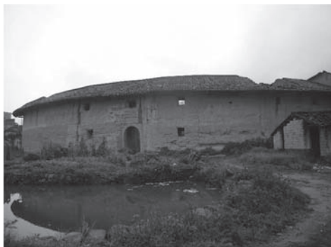
写真2 潮州市饒平県の円形土楼

るが、福佬系の潮汕人も少なくない。つまり、生活文化の視点から見ると、円形土楼は、決して客家だけに特有の建築なのではなく、他のエスニック集団が住む伝統家屋でもある 1) 。