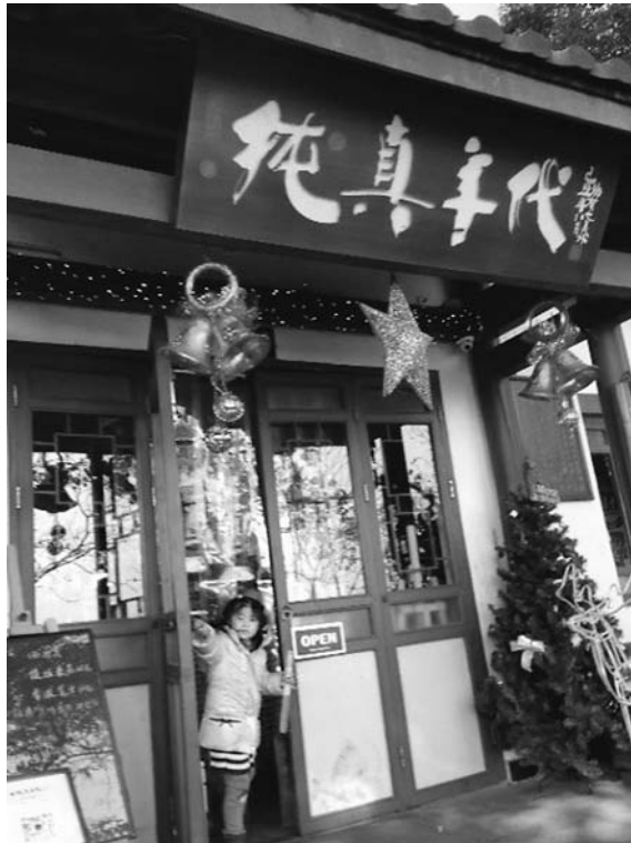
写真3 宝石山の中腹に位置する「純真年代書店カフェ」