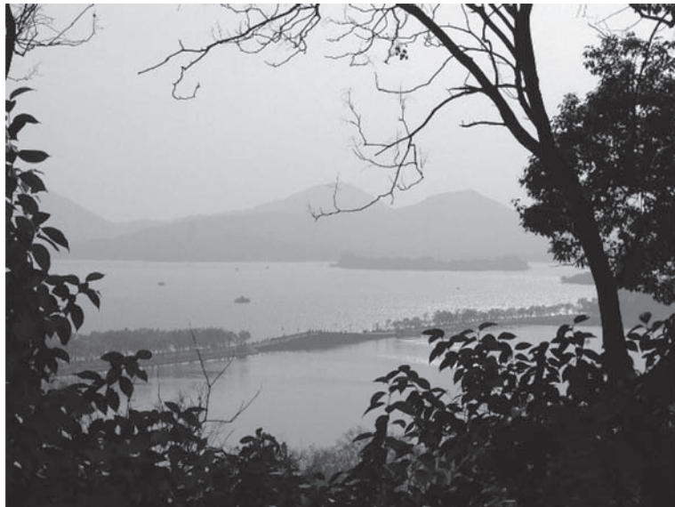
写真2 「純真年代書店カフェ」から眺めた西湖（ 2014.12.14）

宝石山は西湖の北に横たわり、西湖の内側の山脈に位置している。湖の北、西、南の三面と、その外環、中環、内環の山脈の中に、地層年代の最も若い岩があり、低くて緩やかな山脈があるが、それが宝石山である。宝石山は北宋以来、山の東端の脊梁に仏教建築である保俶塔が建てられていることから有名である。1985年杭州で「新西湖十景」が選出された際、宝石山の景観は「宝石流霞」の景観名として、西湖の新たな十景に選ばれた。