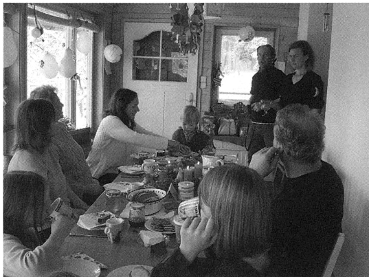
3歳の誕生日を祝う。両親の友人が招待される

このような友人関係が日本にないわけではないが、少ないだろう。むしろ子供は子供、大人は大人のつきあいとして区別する傾向が強い。親の友人と子供の友人が同じテーブルについて議論する風景