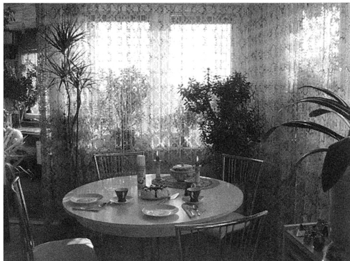
家庭の居間に客を迎えるテーブル。キャンドルを好む（2006年3月 ベルリン）

彼の立場からすると、彼の行動はコンピュータ機器を扱う専門職として、適切に判断した結果として説明されるらしい。その判断とは、顧客の故国の環境基準に適合しないとされるバッテリーを