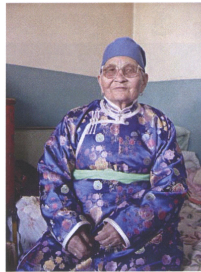
ドルマジャブさん