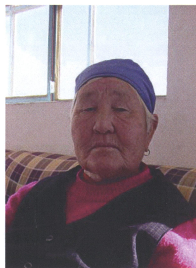
マーモーハイさん