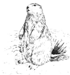
タルバガン。ソロングド・バ・ジグムド「モンゴル医学史」より。

(穴を掘る)」という表現が巷で耳につく。この穴とは、草原のあちらこちらに散見される、タルバガンとよばれる草原モルモットの巣穴をさしている。