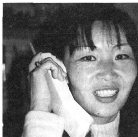
ナランツェツェク。

「まずウランバートルのチェンジ・バザールでトウグルグを中国元に交換するでしょ。そうして北京へ行って買うの、だいたい中国製のジャケット類を。四季折々のをね。それを抱えて国際列車に乗り込み、モスクワへ向かう。道中、停車するごとに、商品を売るわけ。停車時間