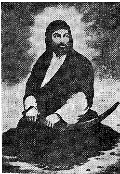
図1 アリー像：手に持っているのが幻の名刀ズール・ファカルである [OYTAN 1955]。

無学な一般の信者に理解し易く解説を行なったり、また、バーザルガンやシャリアティーの聴衆が、職場や学校、バーザル、家庭等の場において、講演の内容をより教育レベルの低い人々に説明を行なったと推察することは容易である。このようにして、思弁的なアリー像は、少しずつ形を変えながら、巾広く人々に伝えられていったのである。