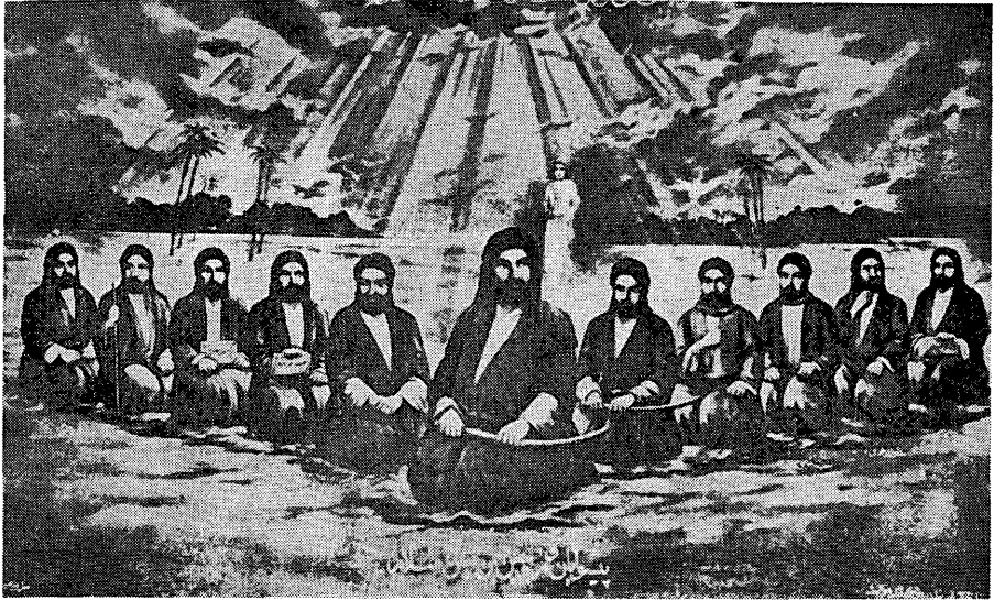
図2 12人のイマーム像：中央がアリーである。やはり、名刀ズール・ファカールを持っている。他は左から、10代目アル・ナキー、8代目アル・レザー、6代目ジャファル、4代目ザイヌル・アーベディーン、2代目ハサン、アリー、3代目ホセイーン、5代目アル・バークル、7代目アル・カーゼム、9代目アル・タキー、11代目アル・アスカリー、そしてアリーの右上部に見える少年は、12代目イマーム、アル・マフディーである [OYTAN 1955]。

動の規範としての宗教は、合理性を持ち、それ故に永続性を持つと考えられる。両者の間に程好い調和がなければならぬ。現代イラン人思想家が、ロゴスとパトスの両面から宗教を理解し、アリーを両者の体現として把握している点は、宗教的シンボルを以上の脈絡で理解する際、非常に示唆的であると思うのである。