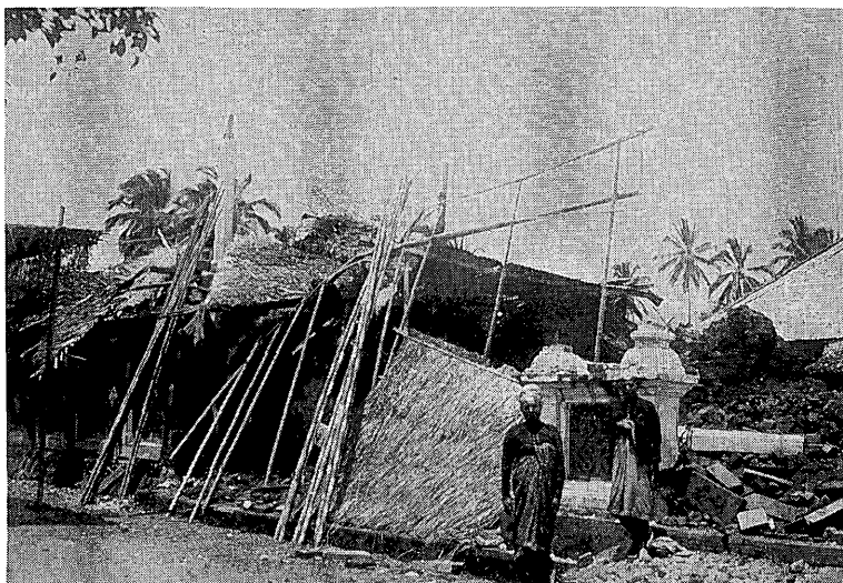
写真1 1917年地震の被害状況をつたえる写真