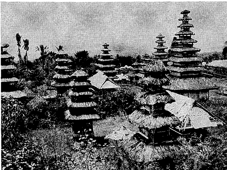
写真4 王立周航船会社 (K.P.M.) が観光客むけに英語で出版した解説付写真集 [GORIS 1930 ca.] に登場するブサキ寺院。W. Spies による写真に当時バリをめぐる最高の学識を誇ったひとり R. Goris が説明を加えている。紹介されている他の寺院のなかでもバリ全土を見降ろす鳥瞰的なアングルが選ばれているのはブサキ寺院だけであり、社会のヴィジョンを提示する視点としての位置をこの寺院は与えられていることがわかる。また写しだされている塔は、その層が重なる形状がバリ社会の階層的秩序をあらわしている。「バリ民族の聖地であり、旧王国すべてがおのおのの寺院を持っていた」と説明は語っている。