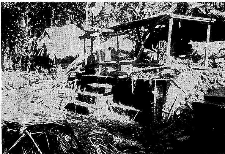
写真2 1917年地震の被害状況をつたえる写真