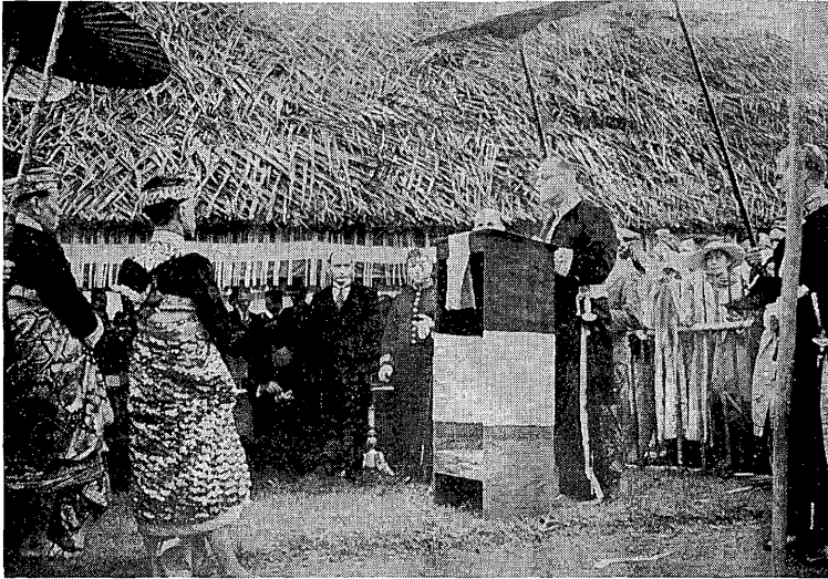
写真3 ブサキ寺院における自治権承認式。自治領代表を前に演説する理事官 [VAN DER KAADEN 1938: 265]。