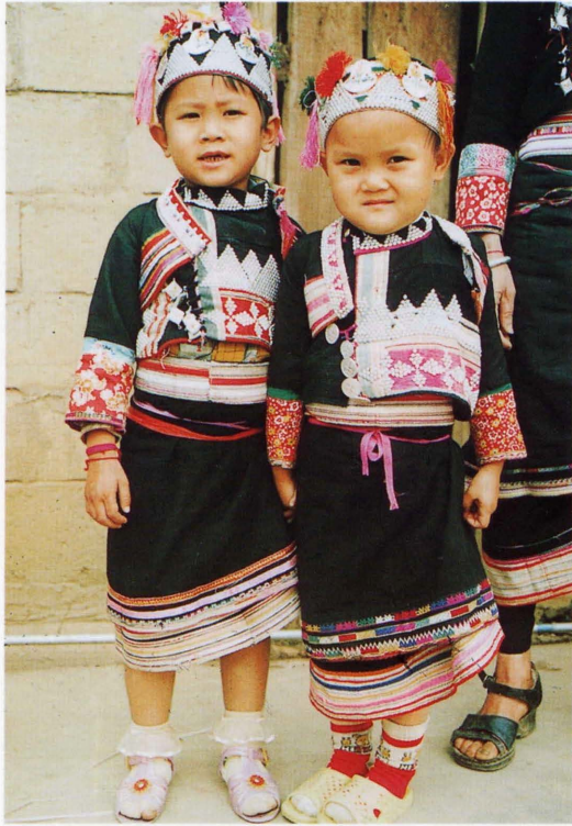
照片5 傣雅女童装束