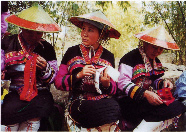
照片6 刺绣——傣洒妇女