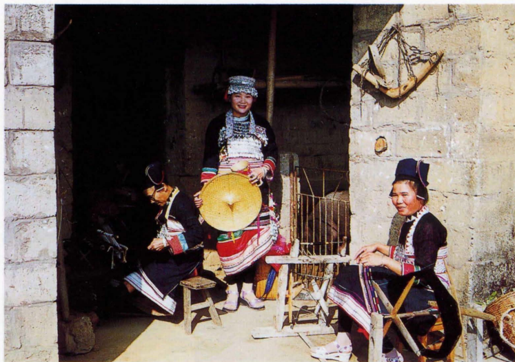
照片3 傣雅妇女纺线