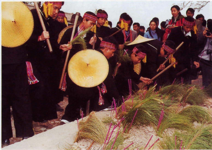
照片8 傣洒春耕祭祀