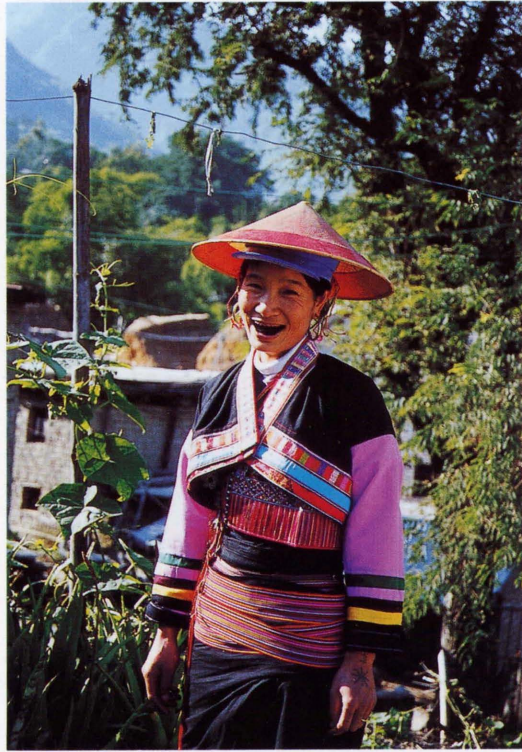
照片7 染齿的傣洒妇女