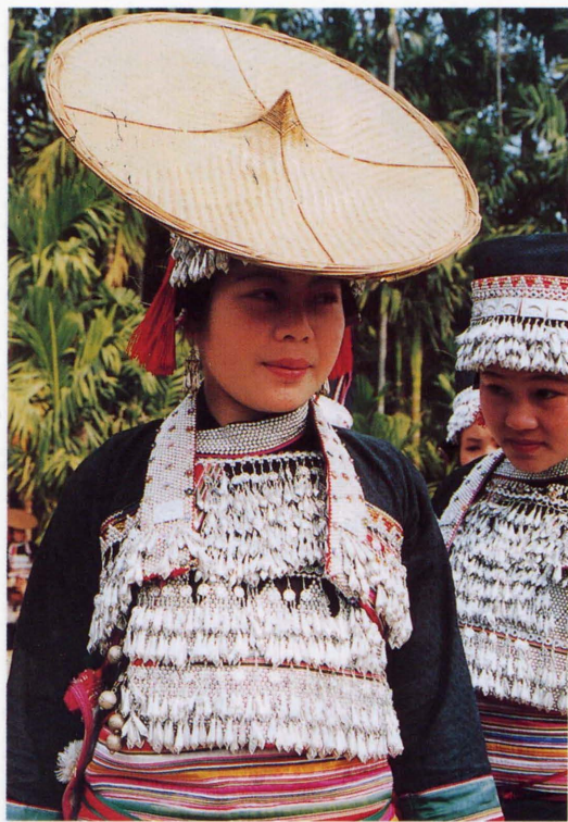
照片4 盛装——傣雅少女