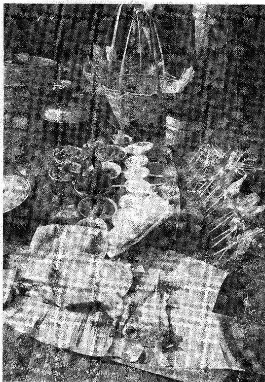
照片2 傣酒祭龙的祭品