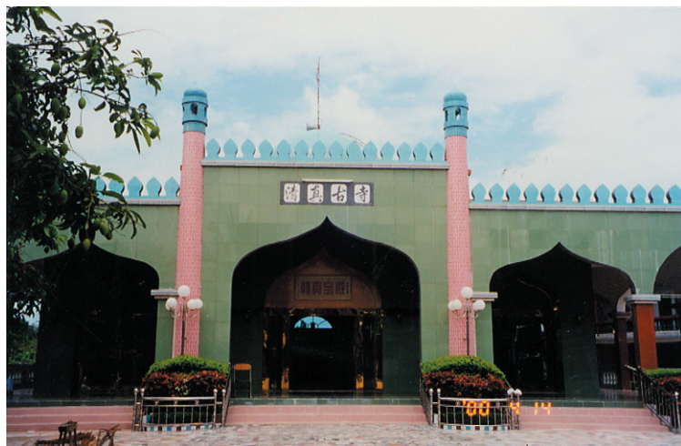
照片4 回辉村的清真古寺