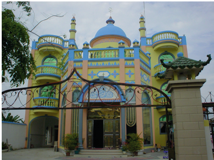
照片3 回新村回族村民的豪华住宅