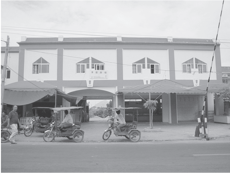
照片 1 回新村回族开办的家庭旅馆