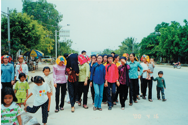
照片5 羊栏回族女子出嫁