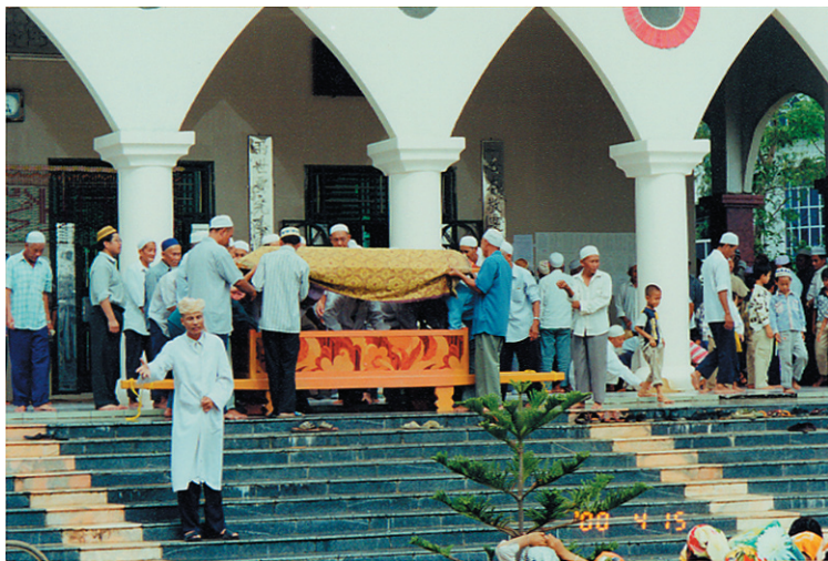
照片6 回新村的回族葬礼