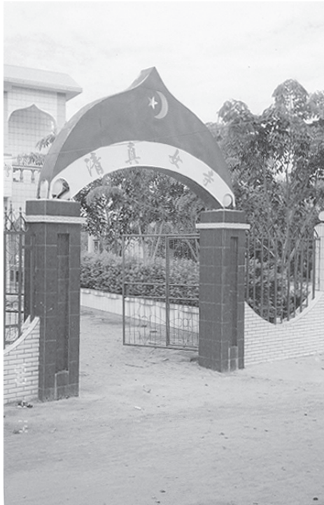
照片 2 回辉村的清真女寺