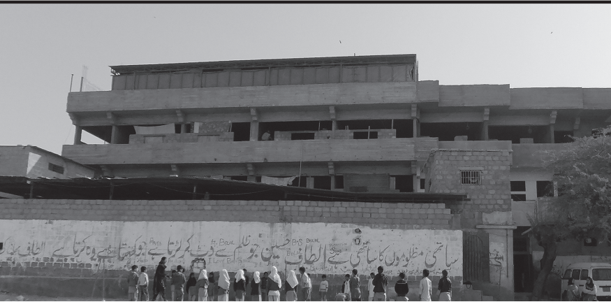
アルカイール・アカデミーの外観。国内外の支援を受けて、次第に規模が大きくなってきた。現在では2500人の生徒たちが学んでいる（2011年1月、パキスタン、カラチ）。