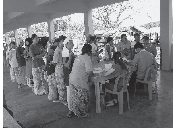
タイ南部トラン県のインド洋津波被災地でワールド・ビジョンが行なった援助物資支給の様子。この被災地では津波直後からNGOが精力的に支援活動を行なった（2006年3月、小河久志撮影）。

同地に関与したのは、キリスト教系NGOであるワールド・ビジョン（World Vision）とイスラーム系NGO／イスラーム復興運