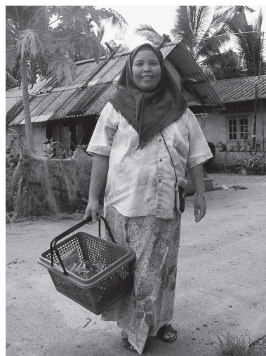
ワールド・ビジョンの支援を受けてお菓子の販売を始めた女性。この仕事はインド洋津波で夫を失った彼女の貴重な収入源となっている（2006年7月、タイ、トラン県）。

2012年6月16日に開催された第3回の研究会では、子島進（東洋大学）による発表「国際協力を地続きのものとする理念と