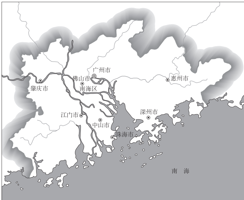
图2 珠三角及其城市示意图