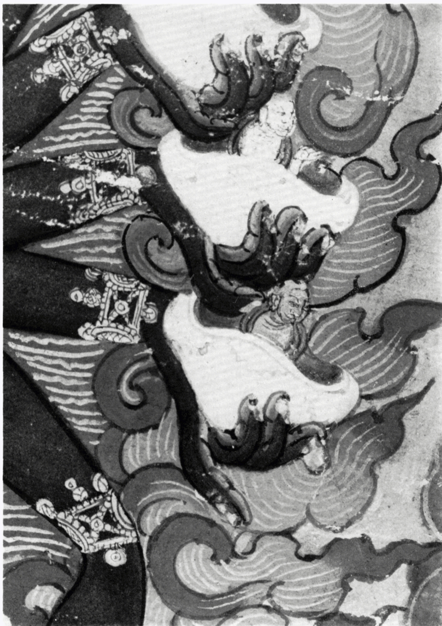
5 f (H 64690) ヘーヴァージュラ画像 部分