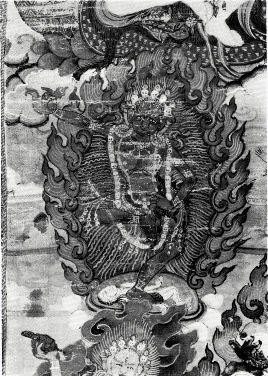
5g (H 64690) ヘーヴァージュラ画像 部分