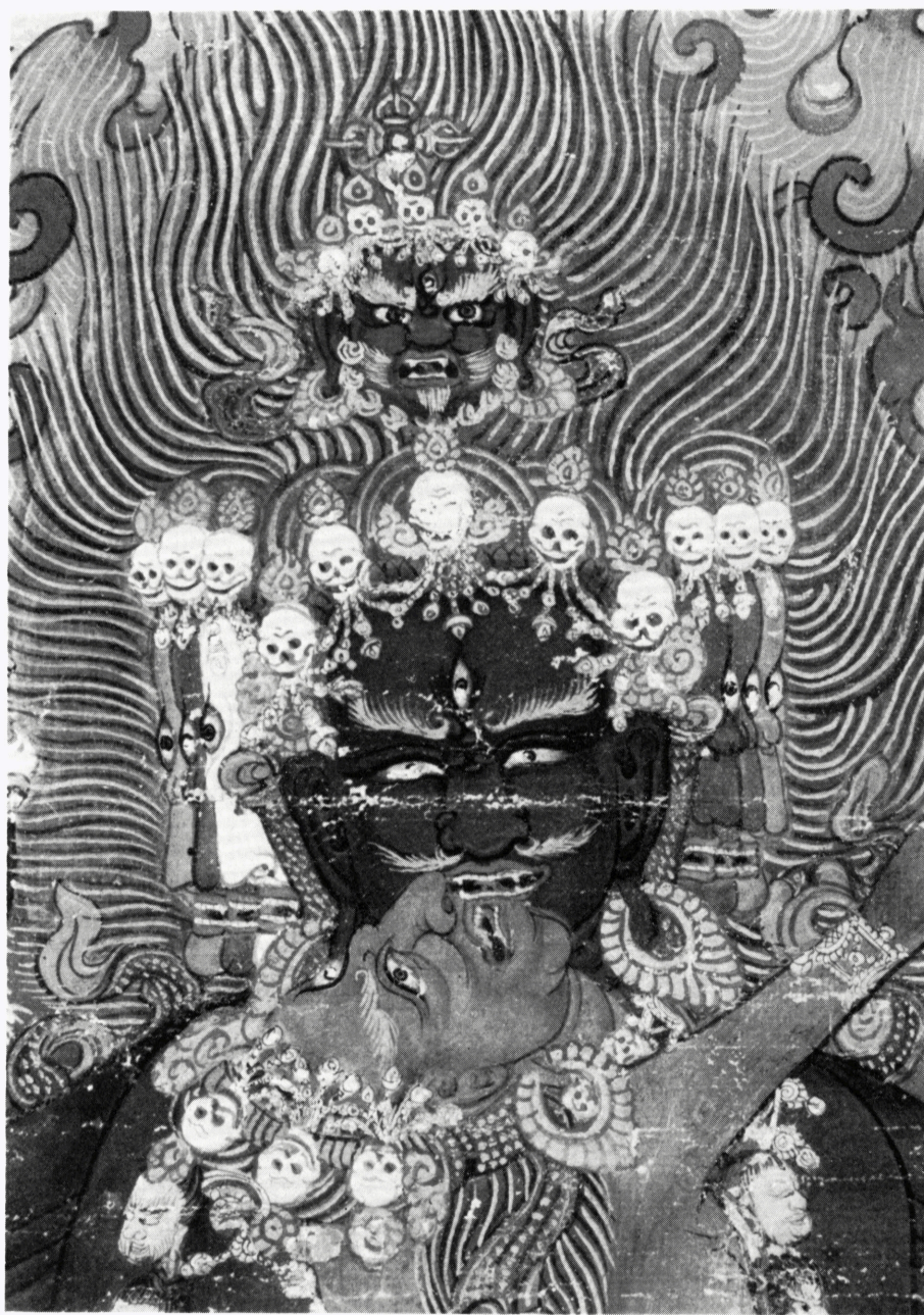
5 b (H 64690) ヘーヴァジュラ画像 部分