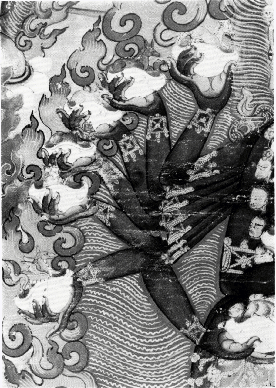
5c (H 64690) ヘーヴェージュラ画像 部分