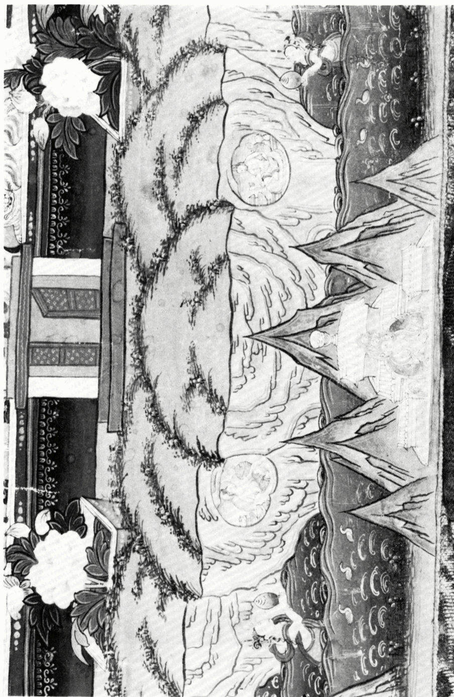
4h (H 64689) パドマサンバヴァ画像 部分