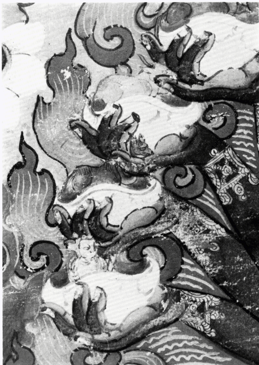
5 e (H 64690) ヘーヴァージュラ画像 部分