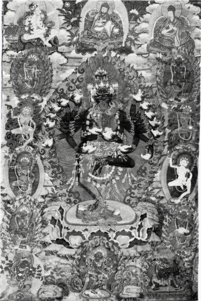
5 a (H 64690) ヘーヴァジュラ画像 全図