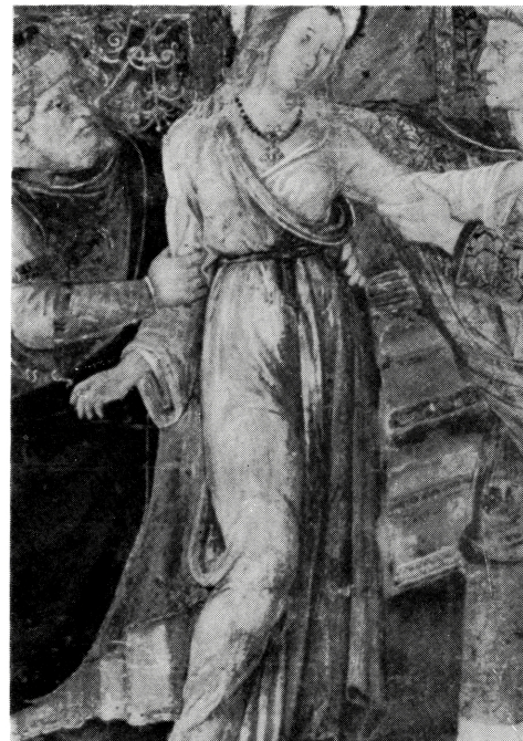
写真 B-42 片袖ぬぎ(?)の円筒衣 1493, 94年