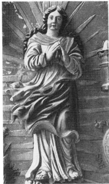
写真 B-34 ひだ状衣の劇的効果 16世紀初め