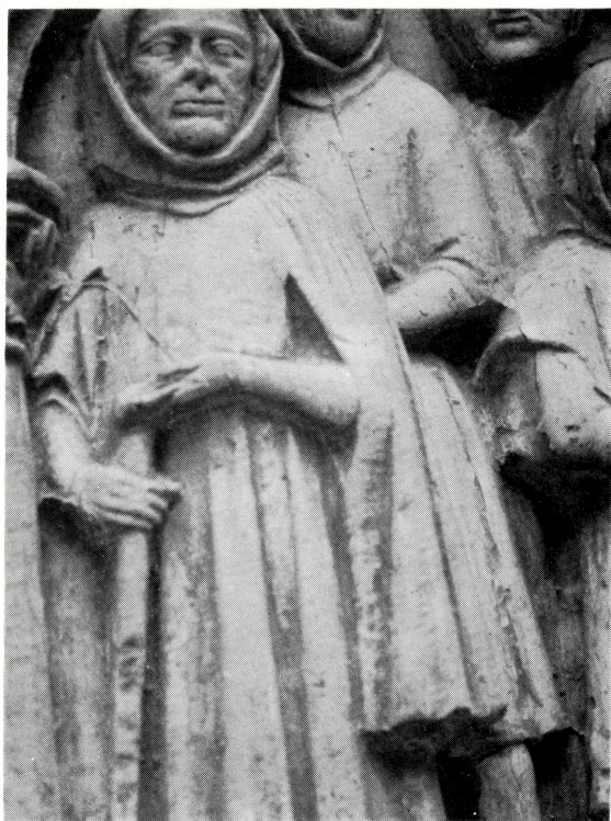
写真 B-39 ラグラン風の垂れ袖