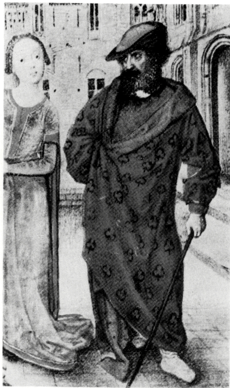
写真 B-44 大きなゆるみをもつ前方開放衣 1456年