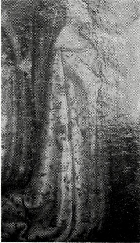
写真 B-35 布形衣効果のためのトレーン