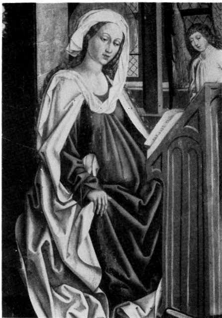
写真 B-33 肥大化した布形衣, 円筒衣 15世紀後半