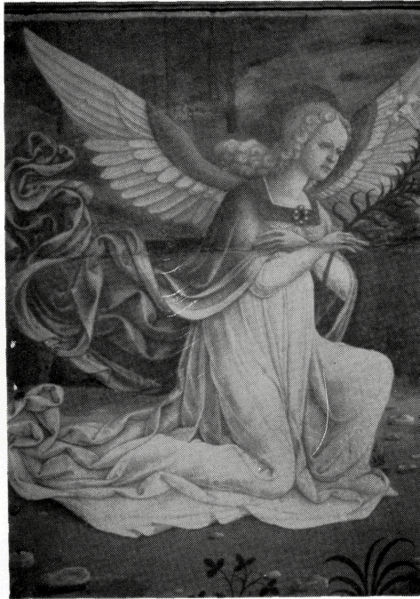
写真 B-31 肥大化した円筒衣 15世紀後半