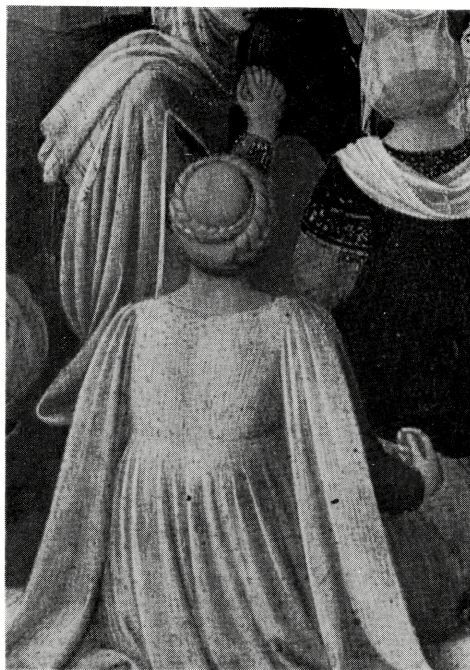
写真 B-41 装飾化した大形の垂れ袖