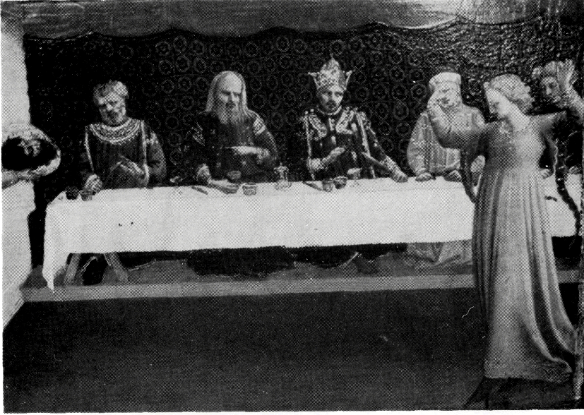
写真 B-30 ヘロデの宴 15世紀初め