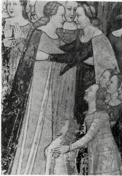
写真 B-36 布形衣効果のためのトレーン