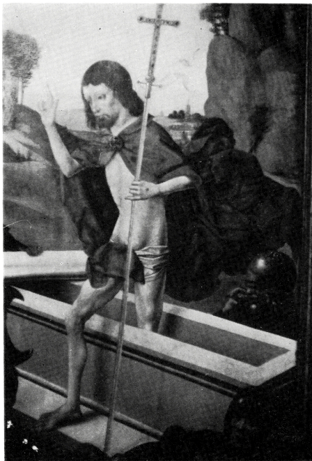
写真 B-32 肥大化したBタイプ布形衣 15世紀後半