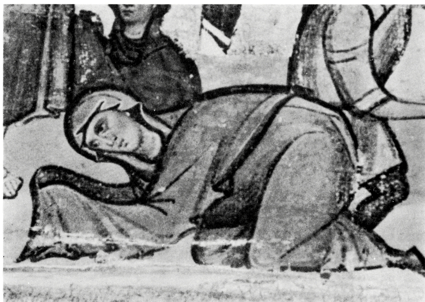
写真 B-38 袖風に手にまいた布形衣