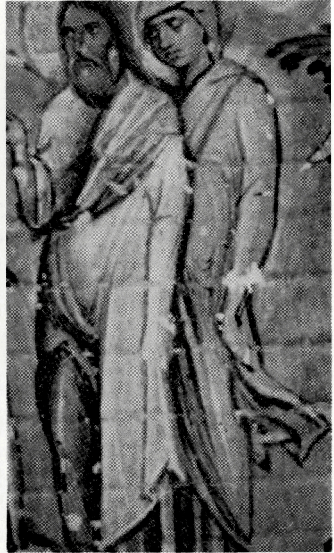
写真 B-37 誇張された袖