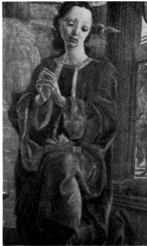
写真 B-45 大きなゆるみをもつ前方開放衣 1469年