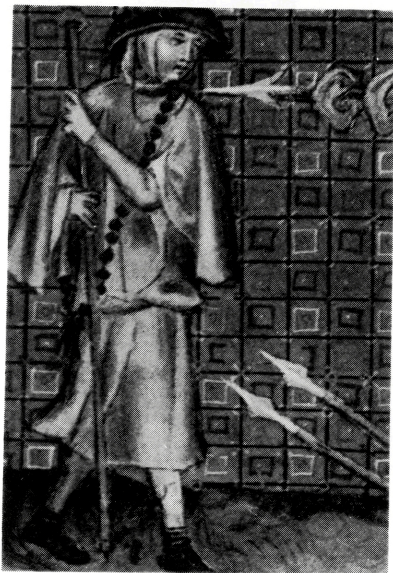
写真 B-40 ケープの裾をひきあげて 手を出す方法