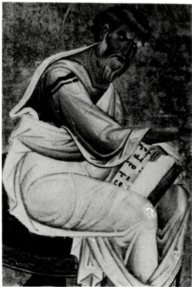
写真 B-17 舟形の袖