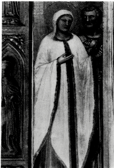
写真 B-14 球状衣としてのBタイプ 布形衣