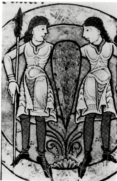
写真 B-18 身体の凹凸を強調する密着衣