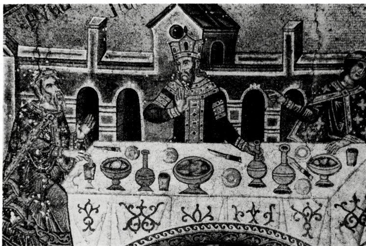
写真 B-28 ヘロデの宴 14世紀