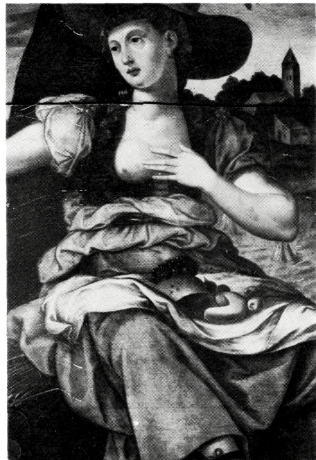
写真 B-16 2重のはしよりをもつ円筒衣