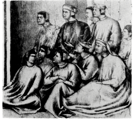
写真 B-22 大きなゆるみをもつ円筒衣