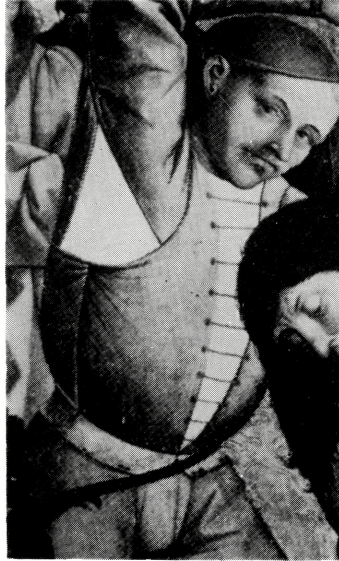
写真 B-21 脇下に大きなあきをもつ袖つけ