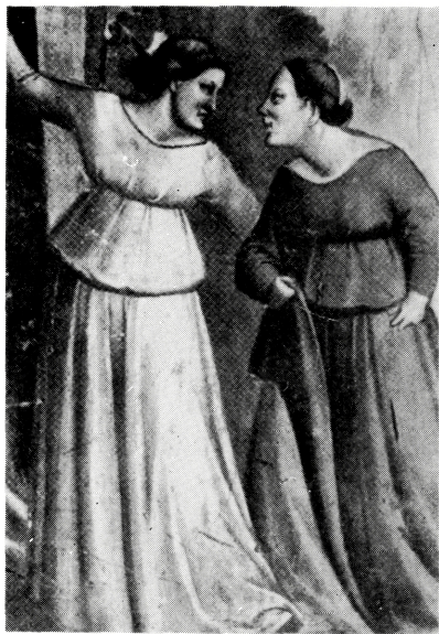
写真 B-15 はしよりをもつ円筒衣