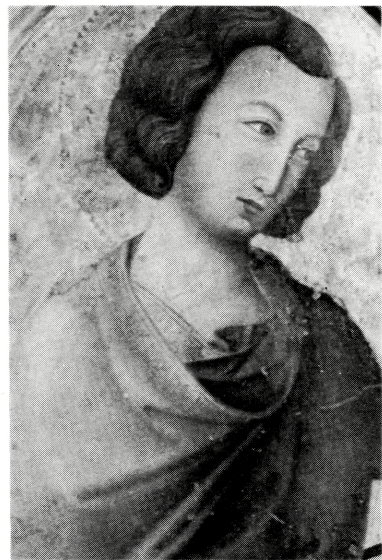
写真 B-19 袴もとにゆるみをもつ円筒衣