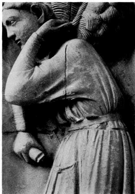
写真 B-25 13世紀のドルマン風袖つけ