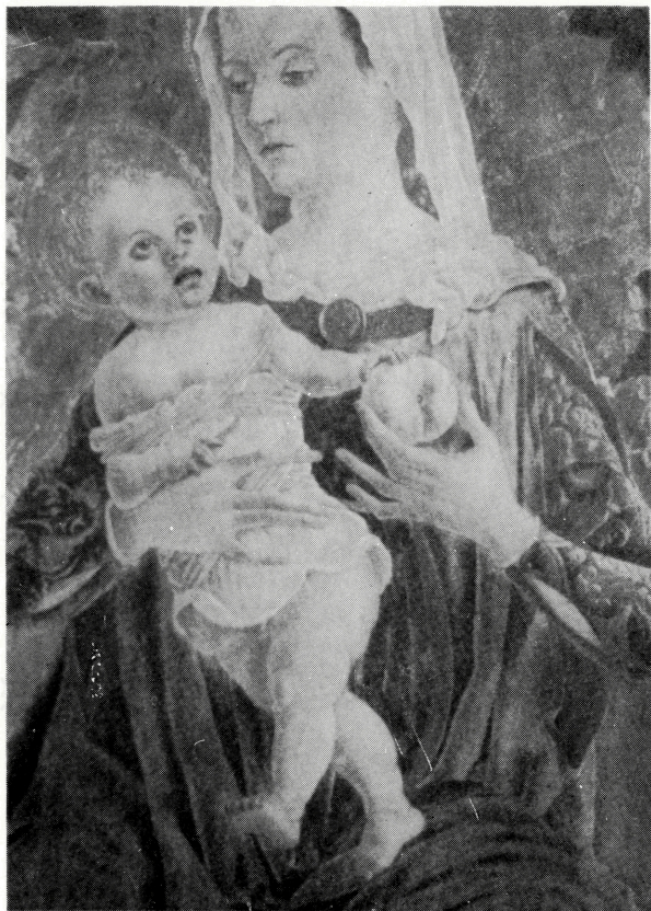
写真 B-26 布形衣風のゆるみをもつ円筒衣の聖母 1461~1463