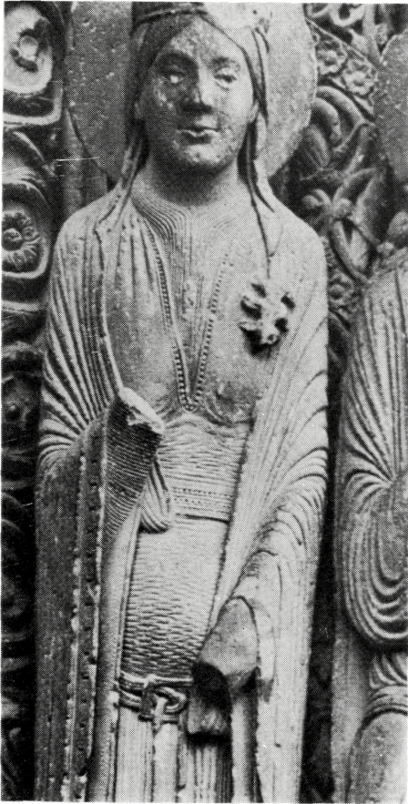
写真 B-20 シャトル派の、しわをもつ円筒衣