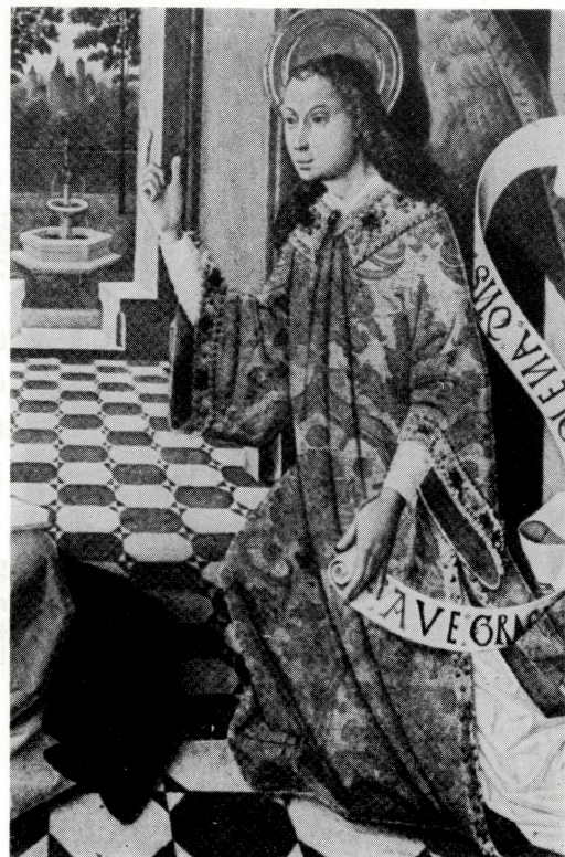
写真 B-27 円筒衣を着る聖告のガブリエル 1475~1500