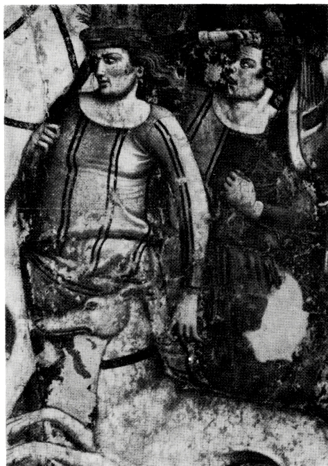
写真 B-24 14世紀のセットイン風袖つけ