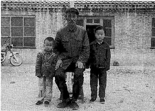
写真2 シニト部のセルジンガ老

ヤングート部は、北京から独自の「神」をもった1人がハルハに行き、ヤングート部の祖先になったという伝承をもつ。ただそれがいつの時代かはまったく分からない