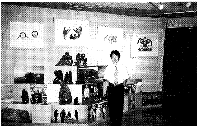
写真4 「人間関係」のコーナー