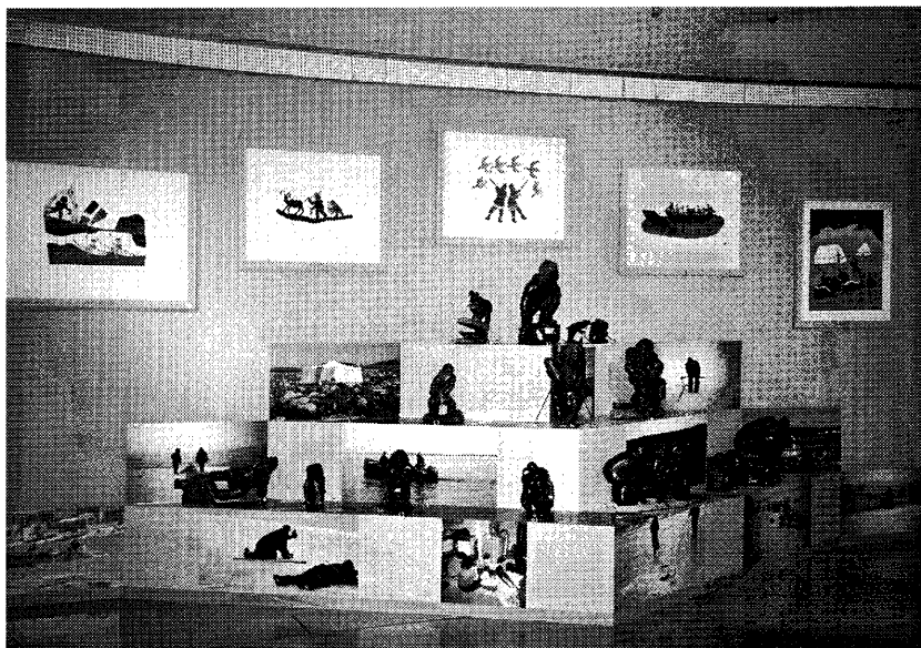
写真3 「生業活動の世界」のコーナー