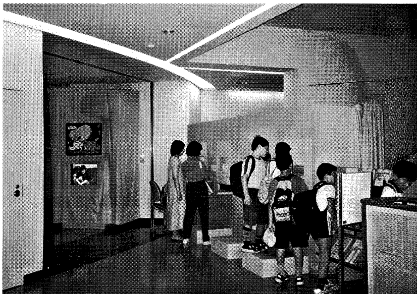
写真5 「ビデオの放映とコンピューター展示」のコーナー

現代のイヌイットはジーンズをはき、暖房完備の家に住んでおり、狩猟の際にはライフルやスノーモービルを利用している。一方、作品の中で描かれている内容は、かつての狩猟生活（犬ぞりや銚や弓矢の使用）、キャンプの様子（雪の家、石ランプの使用）、動物や世界観である。作品とその背後に提示された写真を対照しながら見られた方は、両者の間にある大きなギャップ、すなわち作家が石や紙の上に描き出したイメージとしての伝統的な社会と、ジーンズをはき、スノーモービルを乗り回す現実の社会との間にあるギャップに気づかれたはずである。この作品の上に描かれたイメージは、イヌイットの作家が仲介者を介して外部社会（市場やこの消費者）から要求に応じながらも、主体的に作り出したものである。筆者は、このギャップを展示したのである。そしてなぜそのようなギャップが存在しているのかを問いかけてみた。その回答は、作品は製作者の主体的な表現であるとともに、イヌイット社会の外にある市場に売られるための商品であったからというものである。市場が要求し、よく売れる作品がアドバイザーの指示によってイヌイットによって制作されたのである。