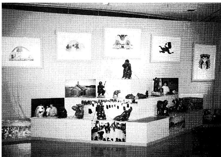
写真2 「宗教の世界」のコーナー