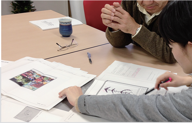
懸案の事項への回答を教員に求める事務職員（手前）。

違う。学芸員がいる一般的な博物館が博物館法その他により設立されているのに対し、民博は国立大学法人法を根拠法としている高等研究機関である。よって、民博の教員たちは、大学の教員と同じく、研究や教育による社会貢献を本分とし、組織の運営にも労働時間の多くを割いている。展示は、民博の教員たちがみずからの研究成果を表現する方法のひとつだが、研究成果を表現する方法は、その他にも多々ある。学術文書の公刊や学術会議での発表、そして民博が組織をあげて取り組んでいる機関研究への参加や、大学共同機関として推進する事業の中核をなす共同研究への寄与をはじめ、挙げはじめるとキリがないようにまで思われる。つまり、民博の教員の仕事は、一部で学芸員の仕事と重なるところこそあれ、合致するものではない。学芸員の仕事をすべて包括して働いていたのでは、民博の教員たちの労働環境があまりにも劣悪になりすぎてしまうといえよう。