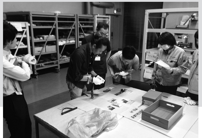
展示施工業者が標本資料を把握する場に立ち会う事務職員と契約職員。

たとえば、ここで焦点をあてた個人の裁量という問題は、労働現場の規律と表裏一体にある、そして労働現場になくしてはならない「グレーゾーン」の活用行為を想起させる。「グレーゾーン」に属する作業においては、各職員の権限が無視されたり、むしろ越権的な行動すら当然視されたり必要とされたりする。これらは、労働現場の規律を乱したり、組織内のアイデンティティを曖昧にしようものとして考えられがちであるが、実は逆に規律