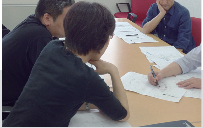
展示の準備会議で、議論を整理し、記録をとる専門職員（左奥）。

余所では同一の職員がこなしている仕事を、複数の職員で協力しておこなっていかなければならないのならば、その人びとのあいだのコミュニケーションは密でなければならない。そういった理由があり、情報企画課の職員たちと教員たちとは、距離が近くなければならないのである。どちらが上か下かというのではなく、この文章でも書いてきたとおり仕事の領分が違うのだが、そうした横並びの三者が三位一体となって、民博ではやっ