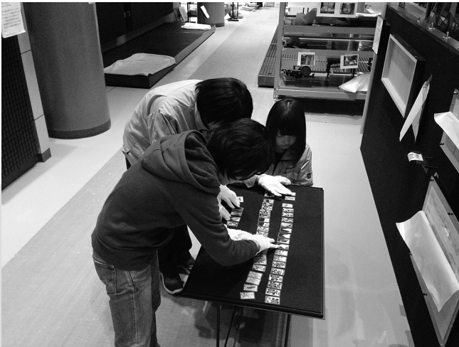
展示をどう配置するか教員とともに考える事務職員と契約職員。

な仕事がありますが、自分で工夫してこなすお仕事だ ありますし、「段取り」などの勉強にもなりますね」