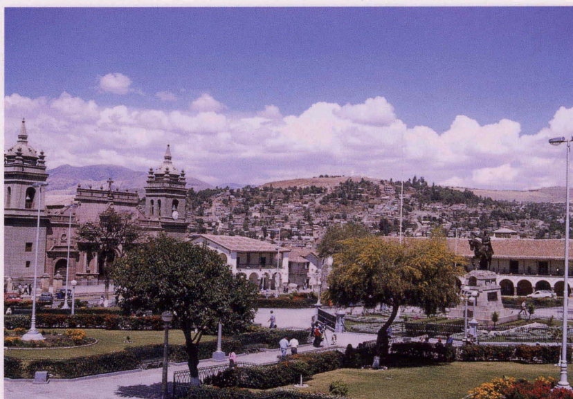
Foto. 5 La plaza de armas, Ciudad de Huamanga 1998