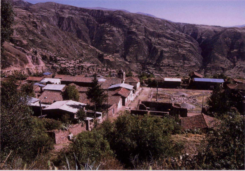
Foto. 7 Pueblo de Paucaray, Prov. Sucre 1997