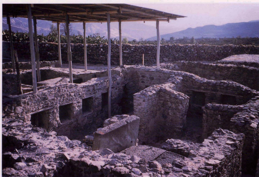
Foto. 2 Cheqowasi de Wari, Ayacucho 1998