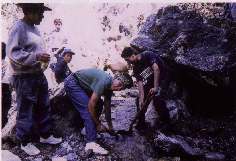
Foto. 10 Limpieza de acequia, Paucaray 1997