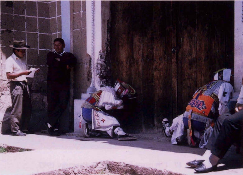
Foto. 19 Danzantes arrodillados ante la puerta de la iglesia, Paucaray 1997