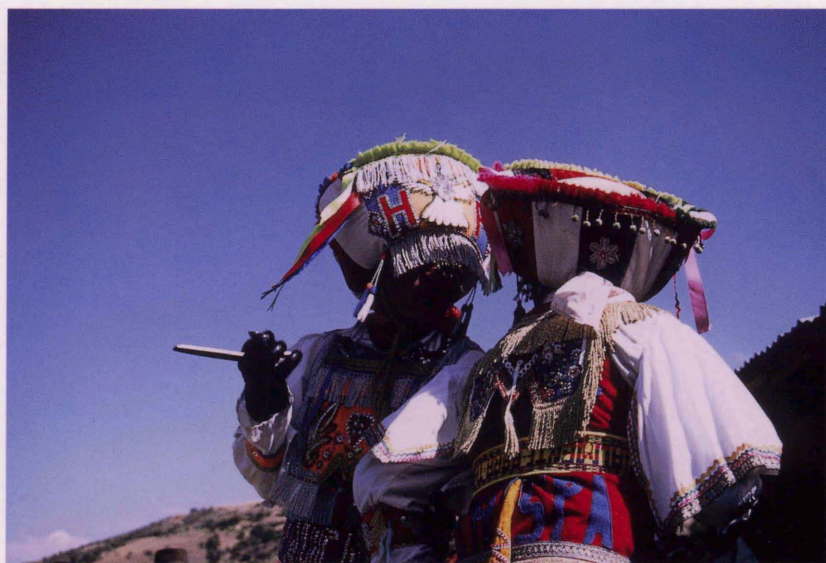
Foto. 13 Los dos dñzantes en competencia, Paucaray 1997