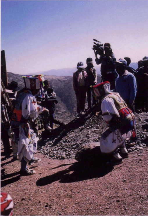
Foto. 18 Un brindis a la tierra, Paucaray 1997