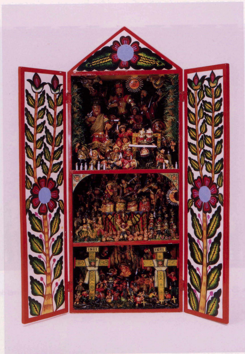
Foto. 24 Retablo “Danzante de tijeras”, obra del maestro Jesús Urbano, Museo Nacional de Etnología, Osaka 1998