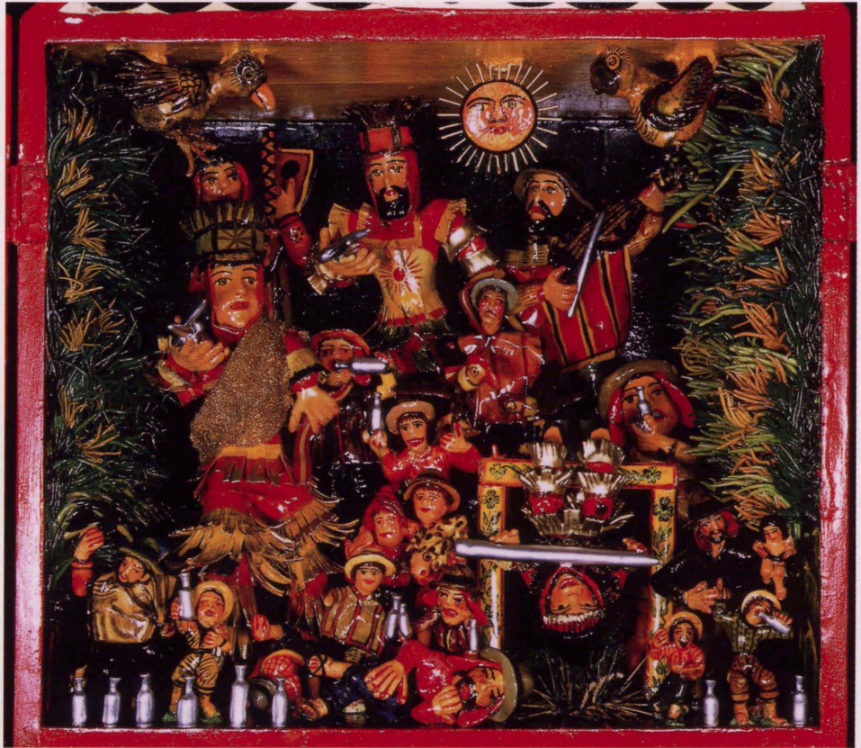
Foto. 25 “Los dos danzantes bajándose de la altura”, el detalle del primer nivel del retablo