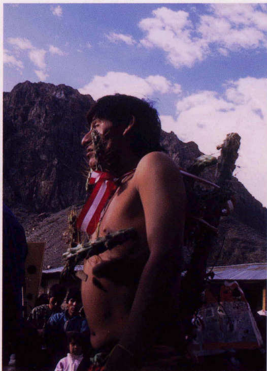
Foto. 15 La prueba de sangre con las espinas, Huataca 1997