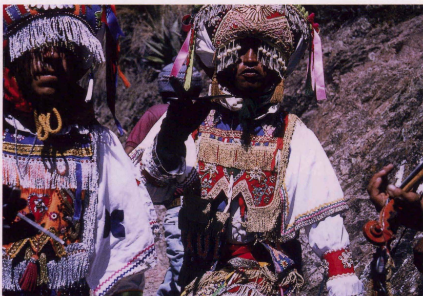
Foto. 12 El rostro casi cubierto con el atuendo, Paucaray 1997