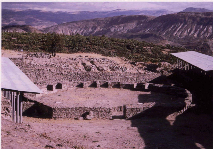
Foto. 1 Templo Mayor de Wari, Ayacucho 1998