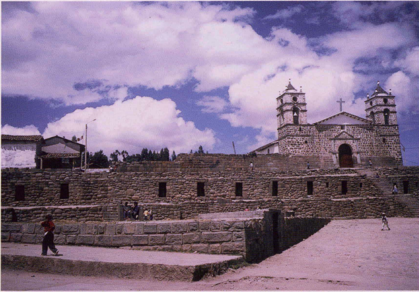
Foto. 3 Templo del Sol, Vilcas Huamán 1998