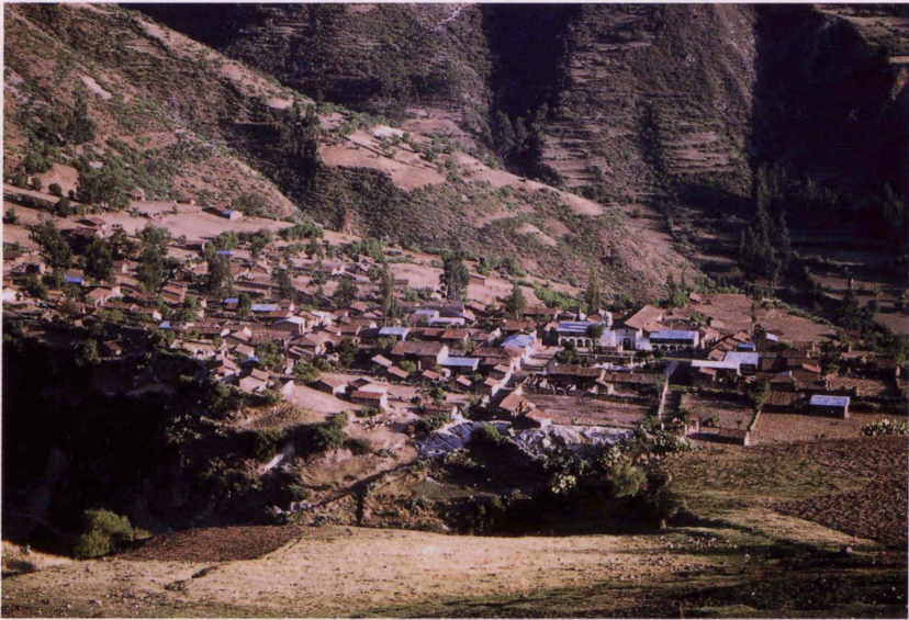
Foto. 8 Pueblo de Paico, Prov. Sucre 1997