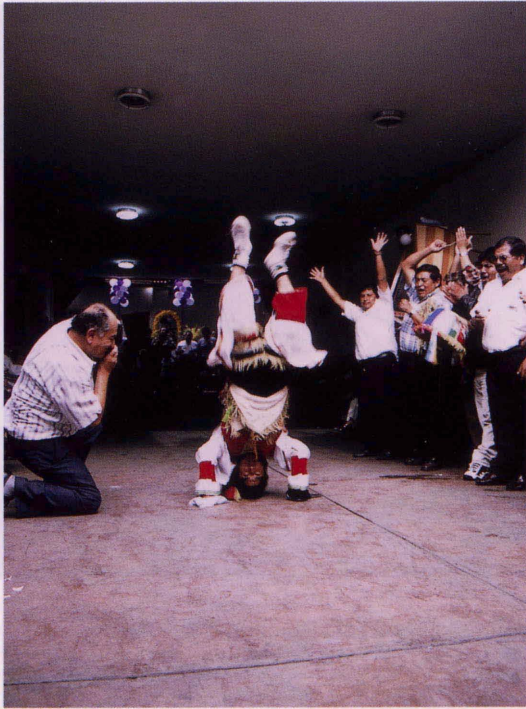
Foto. 22 Un danzante reconocido en Lima, Lima 1997