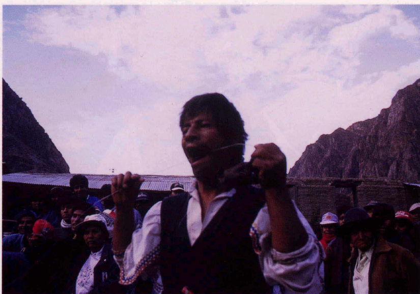
Foto. 14 La prueba de sangre con alambre, Huataca 1995