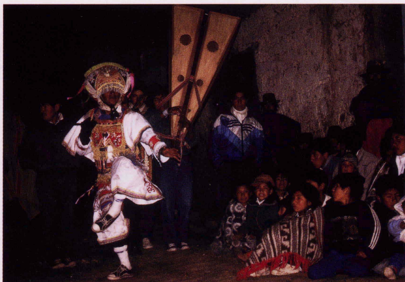
Foto. 16 Los pasos verticales, Paucaray 1997