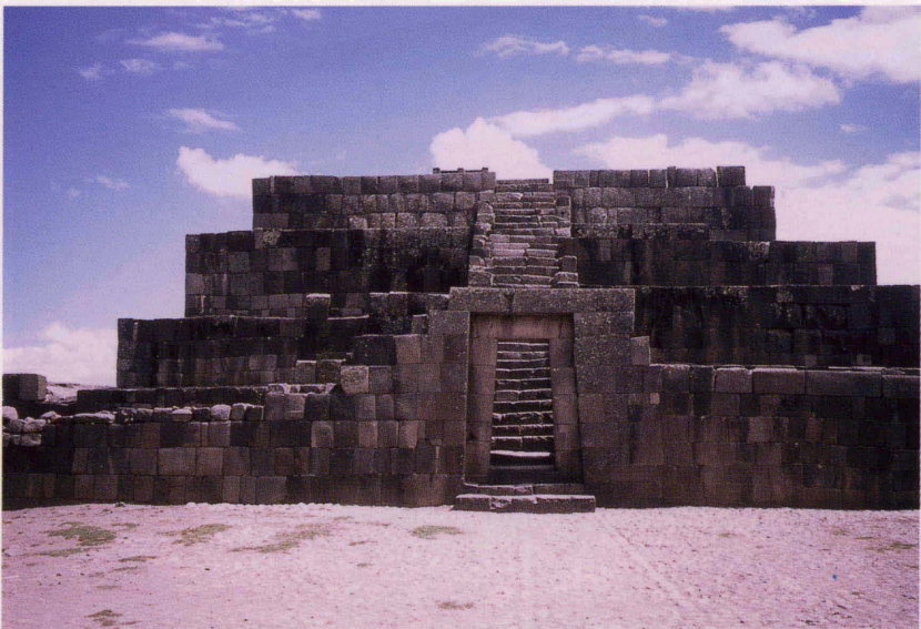
Foto. 4 Ushuno, Vilcas Huamán 1998