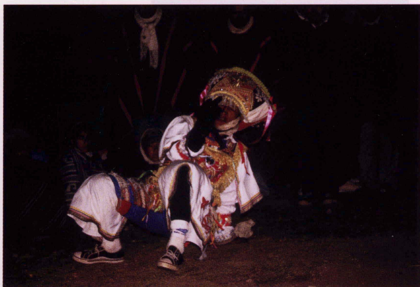
Foto. 17 Los pasos horizontales, Paucaray 1997