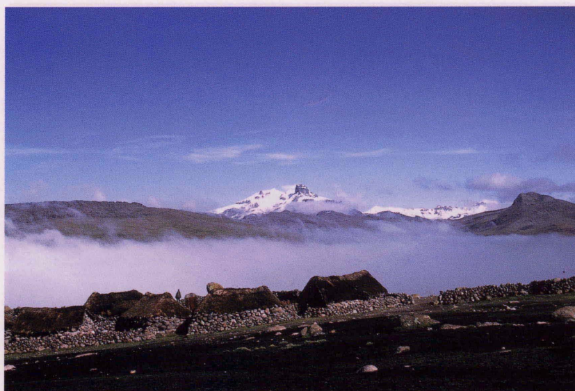
Foto. 6 El nevado Qarwaraso, Prov. Sucre 1997