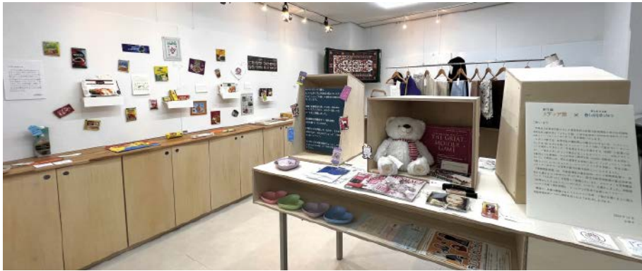
写真3-5 2024年度博物館実習展