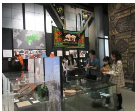
写真3-2 西アジア展示のキスワの前で信仰の道具を観覧する様子（国立民族学博物館 2024年6月8日）

示は展示配置をどのように決め、作業には何人が必要で、資料に負荷のかからない展示はどのような方法かと疑問をもつ受講生も多かった。そのほか、ベールの展示方法についての感想も多数あった。受講生が博物館実習展で使用予定の「世界のイスラムの暮らし2：同時代を生きる」には、イスラム女性用のチャドルやヒジャーブといったさまざまなベールが10点以上同梱され、その収集国は中国、インドネシア、マレーシア、イラン、パキスタン、セネガルで着用方法も多様である。事前にモノ情報カードからベールに関心を持ち、民博での展示方法を観察した受講生（写真3-3）からは、ヘッドマネキンではなく一部は透明の筒を使用した展示であった点や、ベールの巻き方やその違いにどのような意味があるのか、化粧が施されているマネキンにはその国のメイク法がなされているのかなどが挙げられた。さらには食品や雑誌の展示方法への関心も高く、テグスを使用した展示やその使用有無の判断、食品をカゴに入れて配置する理由（ハラールの印が見えにくかったと話す）といった、受講生達の主体的な探究の姿勢や意欲が発表から伝わってきた。