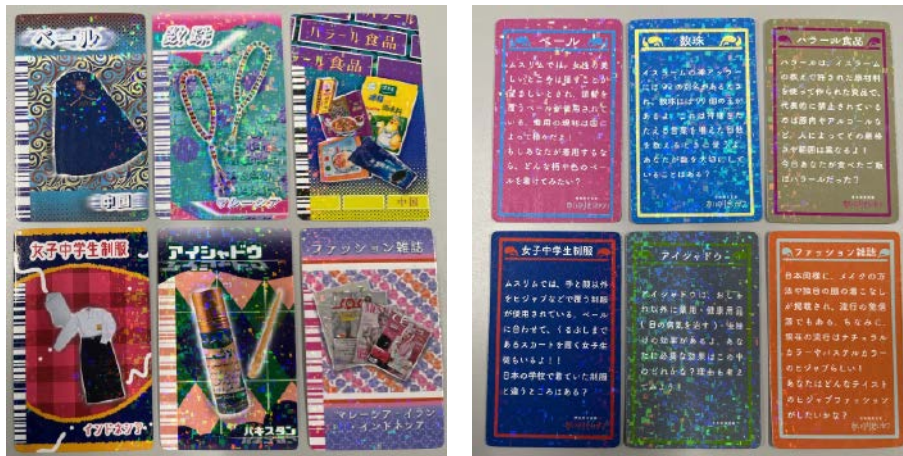
資料3-8 受講生が作成した6種のカード 左が表面、右が裏面

この6種類のカード「ベール（中国）」「数珠（マレーシア）」「ハラール食品（中国）」「女子中学生制服（インドネシア）」「アイシャドウ（パキスタン）」「ファッション雑誌（マレーシア、イラン、インドネシア）」の裏面には、短い解説文と同時に、最後に来場者に問かける一文が、以下のように付されている。