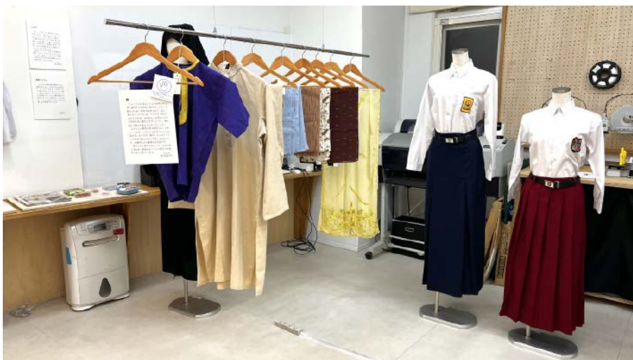
写真3-7 2024年度博物館実習展