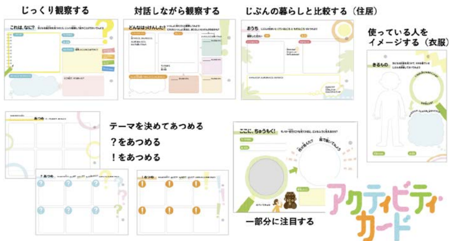
資料3-2 民博が開発した8種類のアクティビティ・カード

民博でのアクティビティを提案する観覧支援ツールとして開発されたのが、「アクティビティ・カード」(資料3-2)である。「どのように見るのか選べる」「何を見るのか選べる」「物を見て、考える力を伸ばす」「なんどでも楽しめる」をコンセプトとし、アクティビティによって見方や考え方を体験するため、自身が実際に見たものやそこで考えたことが重要で、正解や模範解答はない。解答のある課題をこなすものではないという性質上、一度体験したアクティビティでも展示資料と一緒に観覧する人が変わることでも何度でも利用でき、繰り返しの利用で学習体験の蓄積や振り返りが可能になる。カードは8種類あり、シンプルな問いから構成されたアクティビティが、A5サイズの片面1枚で完結する構成である。一つの展示資料を詳細に観察するカード、同級生や家族との対話を通じて新たな発見を促すカード、観たものや感じたことをつぶさにメモするカード、見る方法を提案するカード、自らのくらしと比較して文化の違いや多様性を考えるカード、