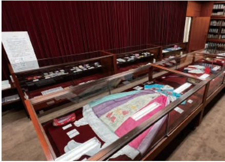
写真3-1 2023年度博物館実習展（甲南女子大学図書館・貴重書展示室 2023年12月2日）

小学校への貸出が最多であり、大学での利用については、近年30件前後にとどまっている。しかしながら、甲南女子大学のように博物館・資料館をもたない大学では、みんぱっくは「博物館実習」における資料の展示や資料の扱い方を実践的に学ぶ有効なツールとなる。したがって、こうした利用方法を高等教育機関に周知し、大学等でのさらなる利用促進を図ることは、民博としての課題でもある。