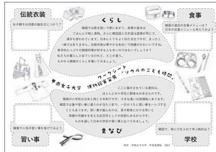
資料3-1 2023年度博物館実習展で配布されたワークシート（松永亮太提供）

甲南女子大学の2023年度博物館実習展は、展示場所の制約からみんぱっくの選定やワークシート（資料3-1）の作成を教員が行ったものの、次年度においては、みんぱっくの選定や展示構成、解説パネルやポスターの作成等を全て受講生主体で進めたいとの担当教員の意向があった。同時に、博物館実習展の視察を終えた社会連携WGにおいても、「博物館実習」を通して民博が有する文化資源の複合的利活用から教育的効果について検証したいとの希望を伝え、両者の意向の下に2024年度の協働教育プログラムが萌芽した。