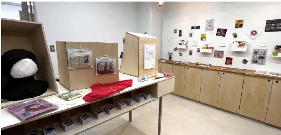
写真3-6 2024年度博物館実習展