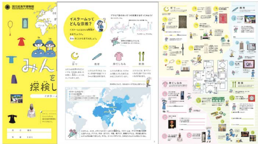
資料3-3 ワークシート「みんなばくを探検しよう! <イスラーム編>」

この解説版は、学校教員や保護者がこどもからの質問に回答したり、対話をしたりしながら一緒に学習可能な構成であり、各展示資料に関する解説のほか、Q&Aや参考資料集も記載されている。そのため甲南女子大学との協働教育プログラムにおいても、来館前の事前学習や来館時の観覧での使用を提案した。