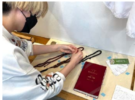
写真3-11 テグスを用いた資料の固定