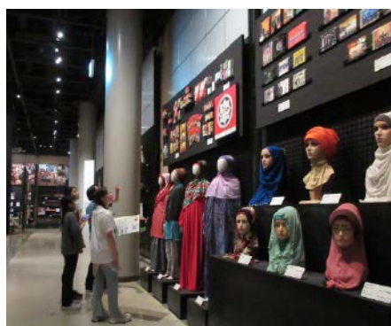
写真3-3 東南アジア展示でベールの被り方や壁面展示を観覧する様子（国立民族学博物館 2024年6月8日）