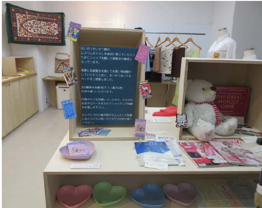
写真3-8 ショップを模した展示構成 (甲南女子大学 2024年12月7日)