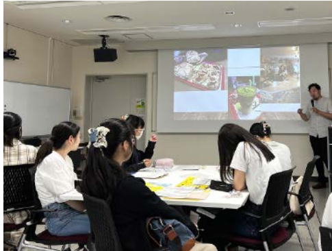
写真3-4 研究者による講義と学生との対話（国立民族学博物館 2024年6月8日）

アでも19世紀に英国植民地下の今日のパキスタンやアフガニスタン周辺からラクダとラクダ乗りがオーストラリアに連れてこられ、地形の調査や開拓の一端を担った歴史があり、そのためアデレードには現在もそうしたラクダ乗りの子孫のコミュニティが存在することなど、受講生が展示観覧の中で抱いた疑問についても、各所で応答を織り込みながら講義は進んだ。