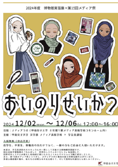
資料3-7 2024年度博物館実習展×第15回メディア祭 「あいのりせいかつ」ポスター (左) とチラシ (右)

「あいのりせいかつ」展の展示方法には、受講生が民博での展示観覧時に得た気づきが、さまざまな箇所でも反映されていた。例えば、小物を均等に壁面に配置して誘目性を意識した点 (写真3-5、写真3-6) や、衣服はマネキン着用展示と同時に、ハンガーに吊るして生活感を醸し出す配置に設計されていた点 (写真3-7)、礼拝用敷物が高い目線で見られるように天井から吊るされていた点 (写真3-8) などである。民博の展示観覧時に得た発見が、彼女らの展示に「生きた学び」として各所に表出していたことは、社会連携WGにとっても非常に大きな喜びであった。振り返りでは、ショップを模した展示場であれば、衣装を気軽に着用できる仕組みがあっても良かった、という意見も挙がった。