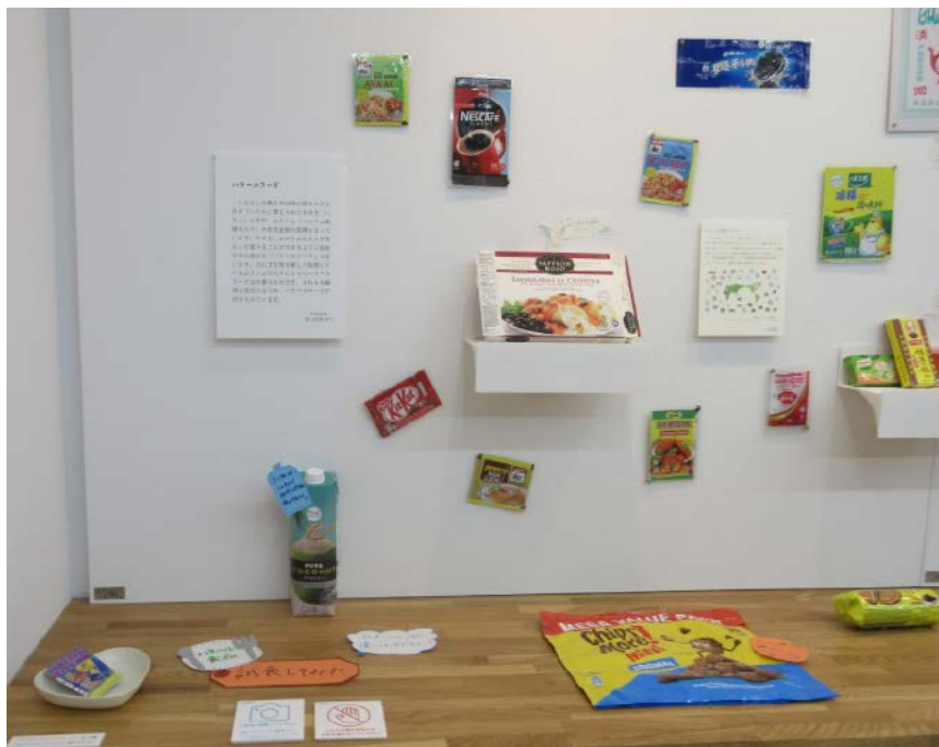
写真3-9 ハラルフードに関する展示 (甲南女子大学 2024年12月7日)