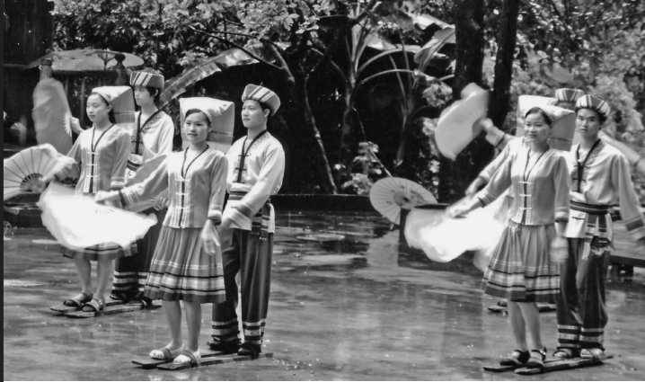
広西、宜州市流河寨でのチワン族の民族舞踊ショー。劉三姐の故郷として観光コースに組み入れられている。劉三姐は伝説上の歌姫として1960年代に映画化され、広西やチワン族のシンボルとして有名になった。

共同研究 ● 中国における民族文化の資源化とポリティクス —南部地域を中心とした人類学・歴史学的研究 (2010-2012)