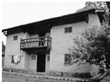
劉三姐の「故居」。一見、普通の民家だが、1990年代に劉三姐がテレビドラマで取り上げられ、そのロケの際に作られた。

本共同研究の目的は、前回の成果をふまえて、現代の中国諸民族の社会において、文化がどのように保存・発展・利用され資源化されているのか、またそこにかなるポリティクスが働いているのかのダイナミズムについて深く掘り下げた検討をすることにある。後者についていえば、文化の資源化に際してさまざまな主体、中央・地方の各級政府、知識人、企業、一般民(都市住民、農民など)の間で