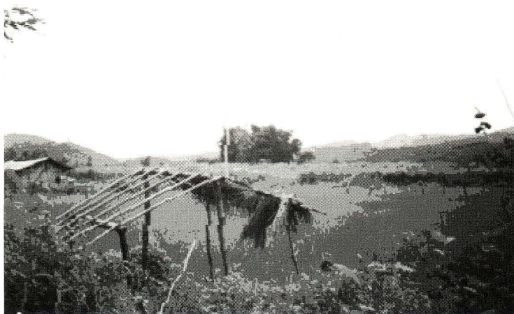
照片 2 狗昂首棚（最初的房子 တၢ်ပုၣ်တၢ်ခၢ်) [tup 35 ma 55 hen 55 ]