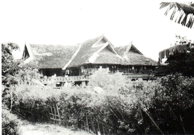
照片 6 现在扩大后的房子形状 (ᠬᠠᠨᠲᠤᠰᠣᠨᠪᠠᠳᠤᠳᠡᠭᠦ) [hən 41 tso: 33 pa:n 55 bat 55 deu 35 ]