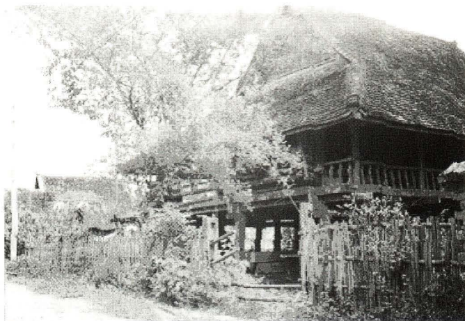
照片 4 密篱笆 (ဟံး 11 sa 11 la:p 33 )