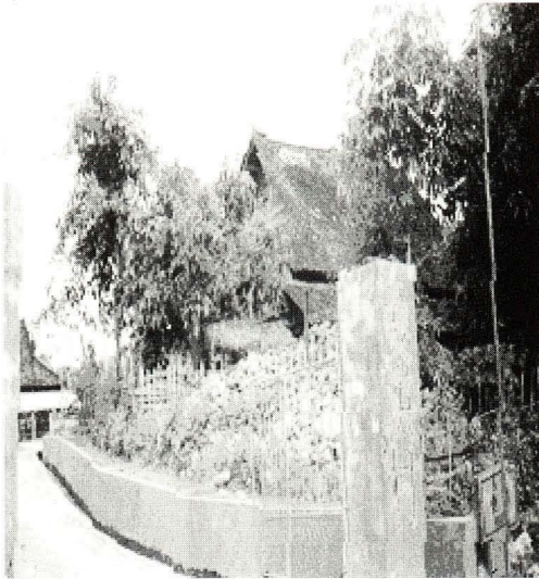
照片 5 稀篱笆 (ᠬᠣᠲᠤᠰᠡᠩ) [ho: 11 ta: 55 seŋ 55 ]