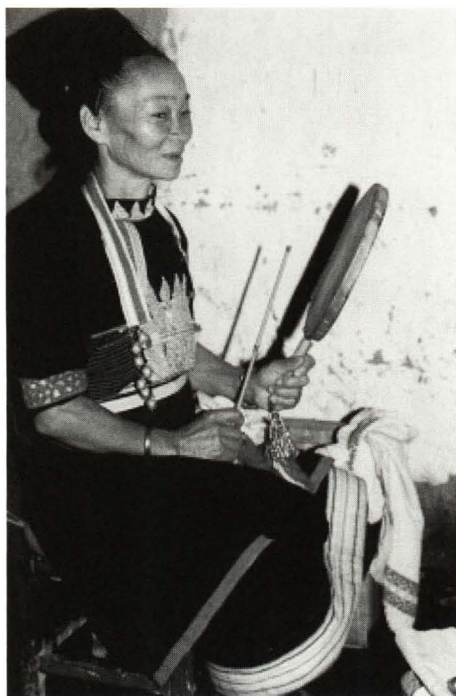
照片3 巫师在念咒语