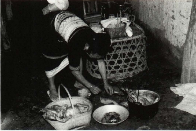
照片5 撵白虎精仪式用的祭物